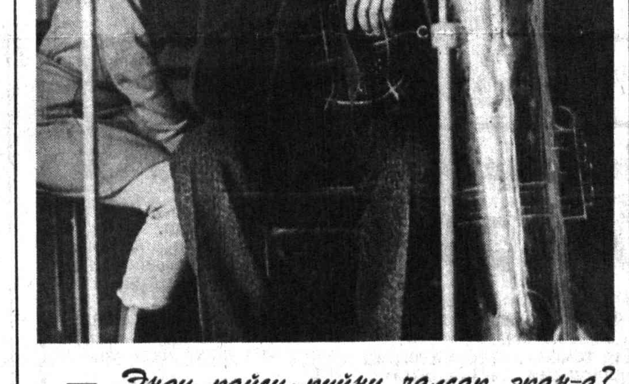
— Энди қайси қўйини танасак экан-а?