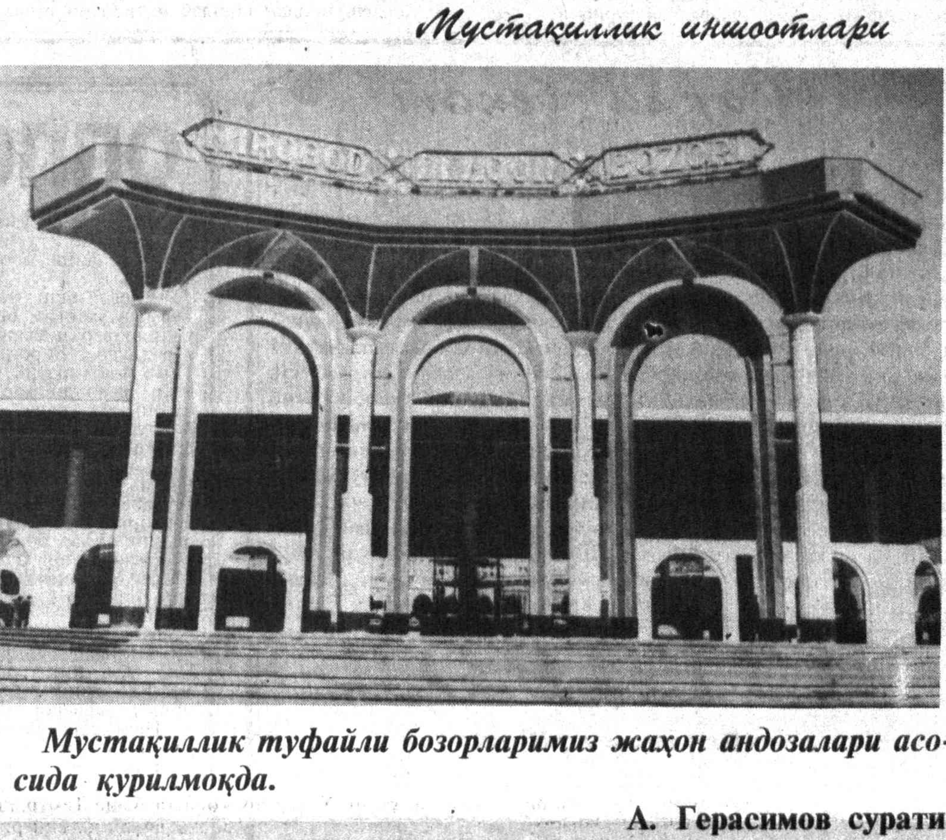
Мустақиллик туфайли бозорларимиз жаҳон андозалари асосида қурилмоқда.

ва ўқувчини ўзига ром қилди. Шундан унинг мақолалари факт ва рақамлар йиғиндисидан иборат бўлиб қолмаган.