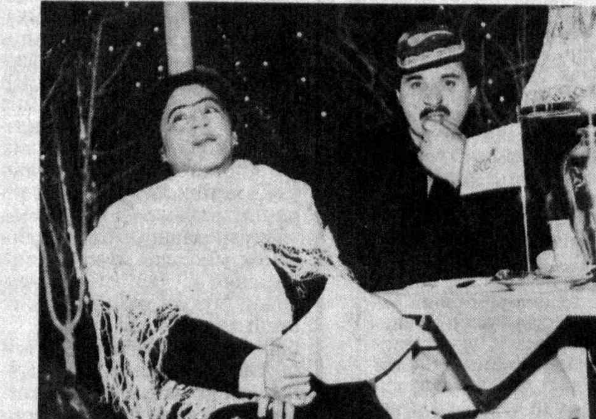
Янги йилни янгиликлар билан кутиб олишга урганганмиз. Суровлардан шу нарса маълум булдики, Янги йил оқшомини кўпчилик ҳамюртларимиз ойнан жаҳон билан бирга қуттишар-кан. Топкент телевидение студиясида ва «ТВ-2» студиясида аһна-навий «Янги йил баъзи»ни суратга олиш ишлари якунланди. Янги йил дастурини кузатиб бориш давомида таниқли кўшиқ-чиларнинг турли жанрларда ижод қилувчи артистларнинг чи-қишларини томоша қиласиз.