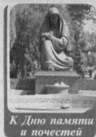
К Дню памяти и почестей

В Национальном пресс-центре Узбекистана в связи с 9 Мая — Днем памяти и почестей состоялась встреча, посвященная чествованию участников Второй мировой войны и ветеранов труда, внесших огромный вклад в развитие национальной печати.