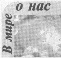
В мире О нас