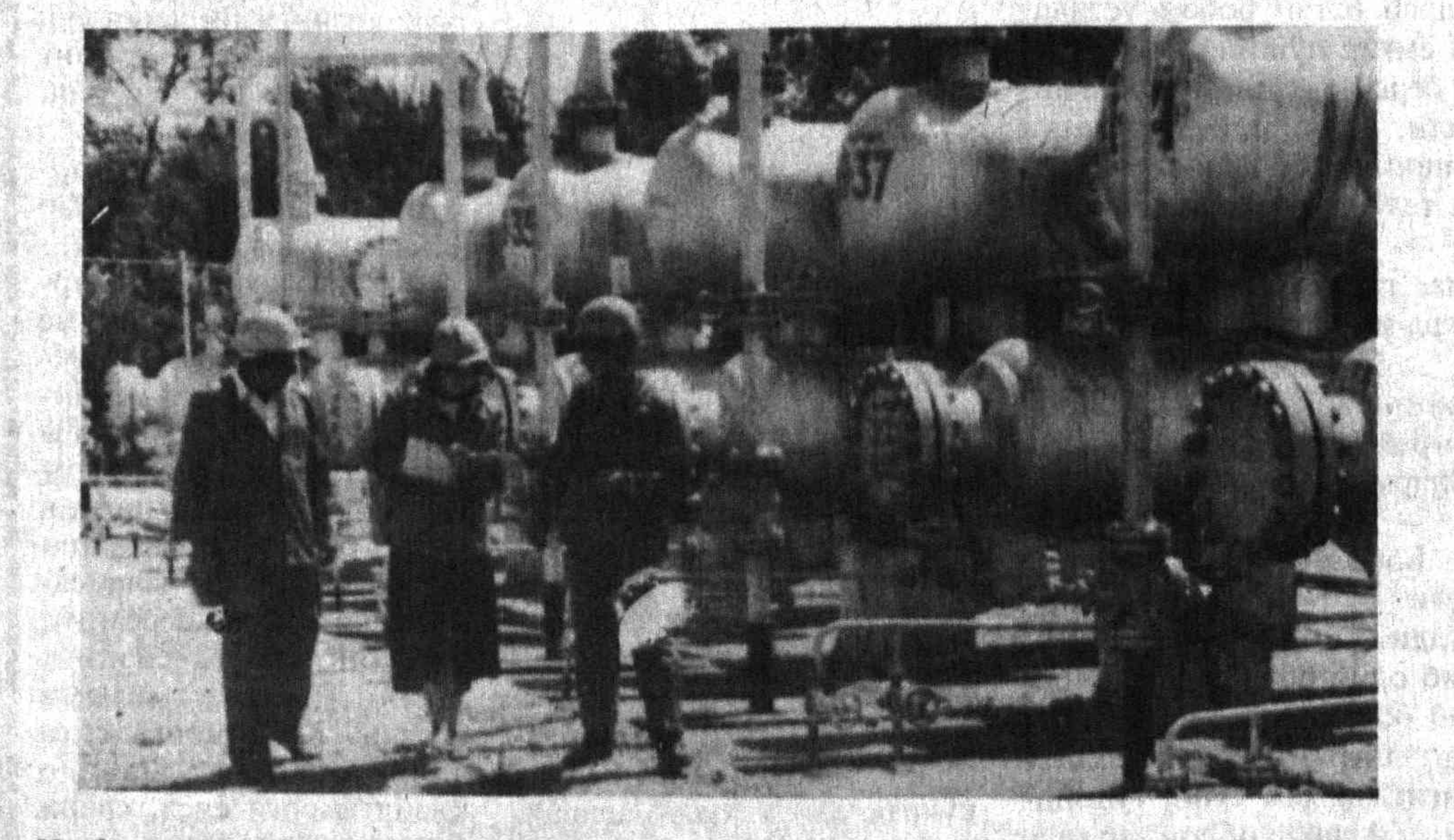
Мубораккат ёшлар мамлакатимиз билан-энергетика мустақиллиги йўлида самарали меҳнат қилишмоқда.

Шу сонга хабар Таълим самараси кадрларга доғлиқ Жиззах вилояти фаолларининг «Кадрлар тайёрлаш бўйича миллий дастур» ва «Таълим тўғрисида»ги Қонун лойиҳалари муҳокамасига бағишланган йиғилиши бўлиб ўтди. Унда вилоятдан сайланган Олий Мажлис депутатлари, вилоят кенгаши депутатлари, шаҳар ва туман ҳокимлари, олий ва ўрта махсус ўқув юртилари, мактаблар раҳбарлари, халқ таълими бўлимлари мудирилари, кенг жамоатчилик ва оммавий ахборот воситалари ходимлари қатнашди. Йиғилиш иштирокчилари Республи-ка Бош вазирининг ўринбосари А.Азиз- жаевнинг «Кадрлар тайёрлаш бўйича мил-лий дастур» лойиҳаси, Олий Мажлис фан, таълим, маданият ва спорт масалалари қўмитаси раисининг ўринбосари П.Қодировнинг «Таълим тўғрисида»ги Қонун лойиҳаси ҳақидаги маърузаларини тингладилар. Сўзга чиққанлар миллий дастур ва таъ-лим тизимини янада такомиллаштириш юзасидан фикр-мулоҳаза билдирдилар. Ингилишда Республика Олий ва ўрта махсус таълим вазири О.Салимов қатнаш-ди. (УзА)