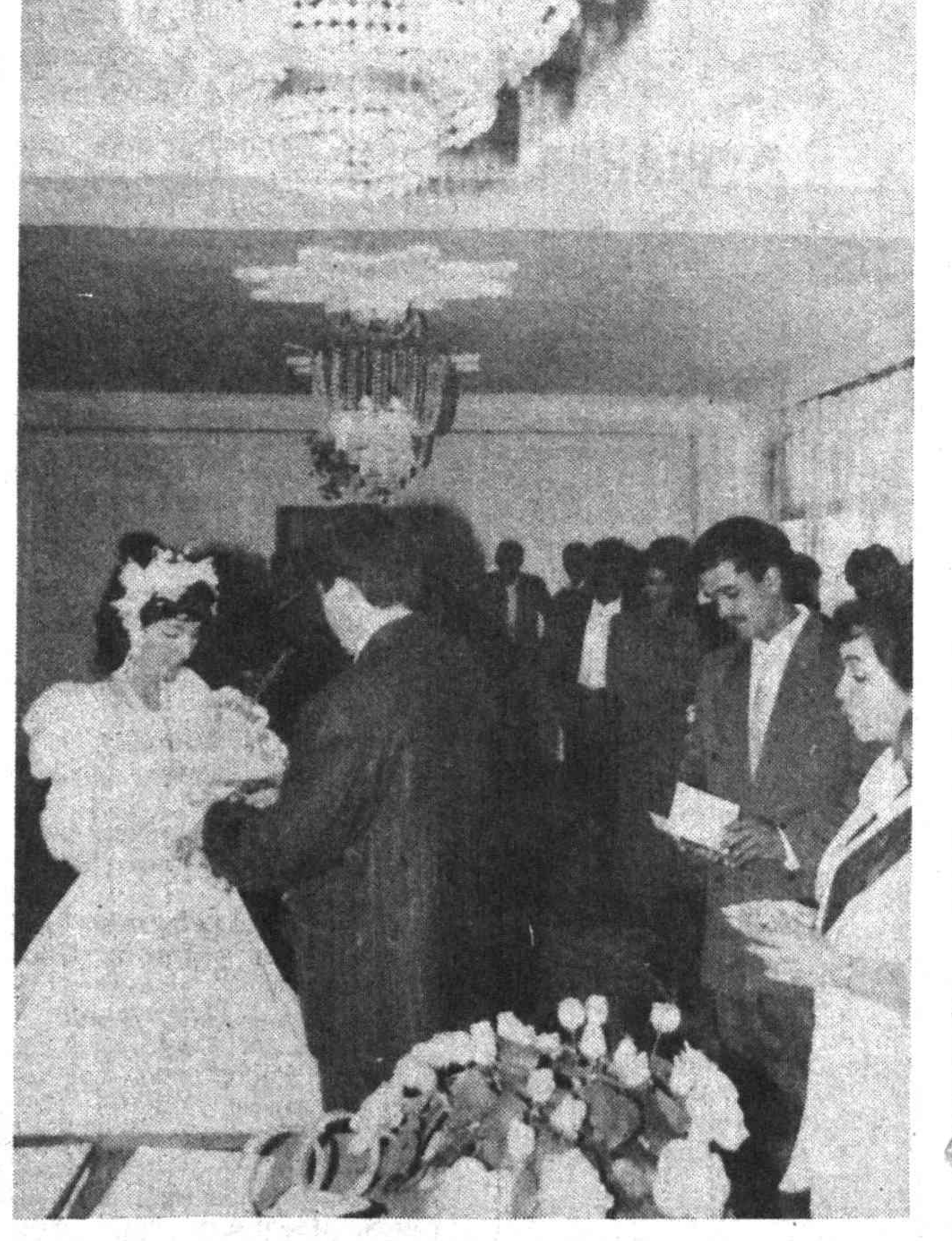
"Бахт уйи"дан бошлаб кетсин бахтли йўлар, Сенинг олоқ қўйлағингдай олоқ улар. Дусту ёрлар гўвоҳ қўлинг тумани Менга, Бошиндан зар сочайми ё сочай гулар...

Суратда: Юнусобод тумани Бахт уйида келин-куёвини никоҳлаш маросими.