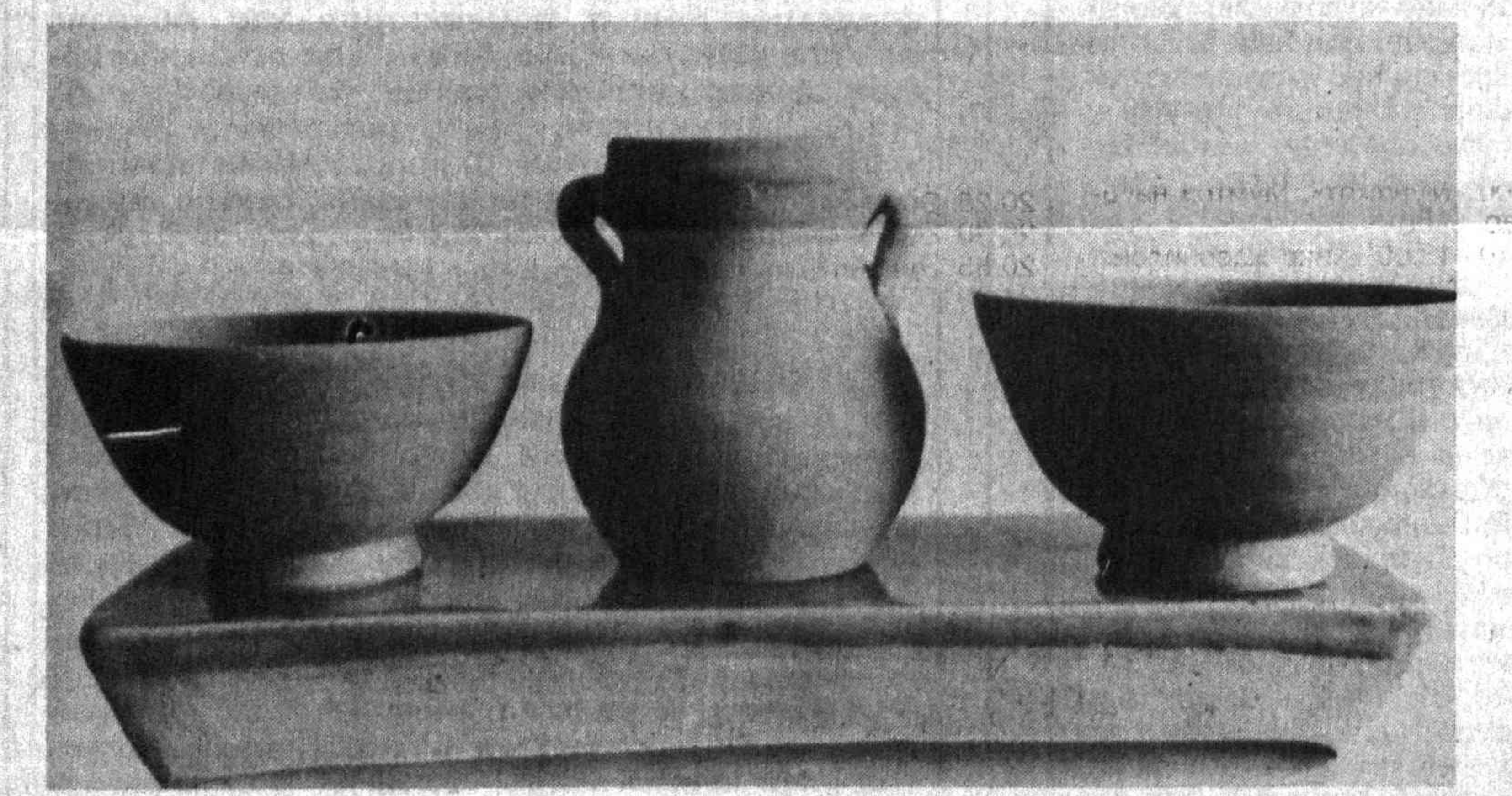
Суратларда: Тайёр маҳсулотлар.

атрофида таҳлил этилган эди. Шарқона жамиятда давлат бошқарувининг ўзига хос бу модели Президентимиз асослаб берган беш асосий қондаларга таънади.