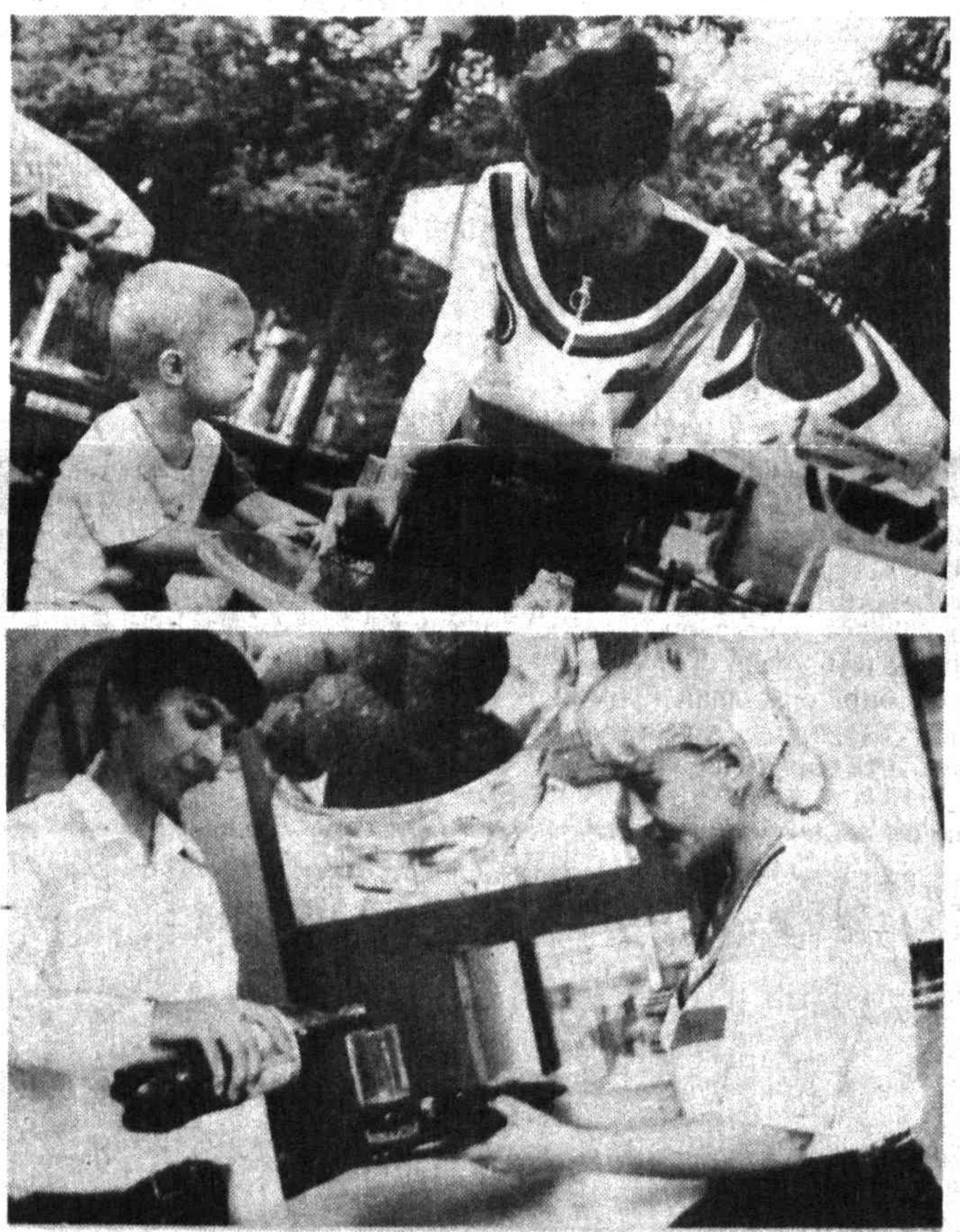
Миллати, динидан қатъий назар унда кишилар эмин-эркин, тинч-тотув яшайдилар. Бу истиқлолимиз шарофати.