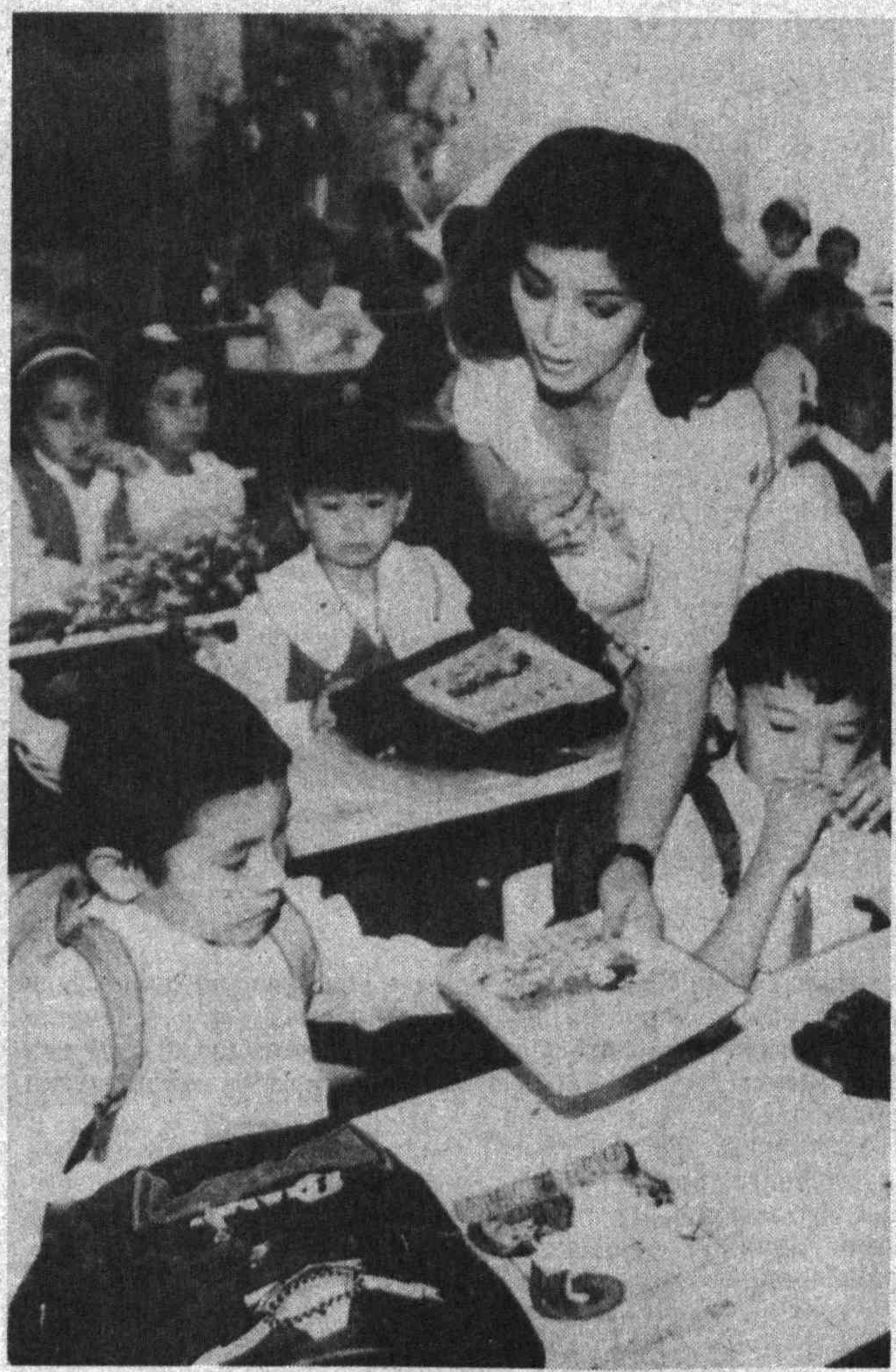
Республика мактабларининг биринчи синф ўқувчиларига Президент совгалари — ўқув учун зарур аниқлеп тарқатилди.

Замонавийлик Ишлар амалга оширилди. Бу соҳада ҳали амалга оширилиши керак бўлган ишларнинг кўлами ҳақида қандай фикрлариниз? Халқаро ҳамжамиятда ўзининг муносиб ўринини топиш ва иқтисодий жиҳатдан ривожланиш боғида кетаянган республикамизда демократлаштириш бўйича катта ишлар амалга оширилди. Мен Буюк Британиядаги икки курсни тугатиб ва чет эл матбуотида халқаро ҳуқуқ бўйича бериладиган мақола ва хабарлардан шу фикрга келишим-ки, бозор иқтисодийнинг ўзида ривожлантирилган, иқтисодий жиҳатдан мукамал ириқ давлатларда ҳам ҳуқуқшунослар учун, аниққиса биз адвокатлар учун ишлар ҳали етарли экан. Юртимиз ҳуқуқшунослари олдида турган вазифалар ҳақида тўхталадиган бўлсам, бугун қонуларни мукамаллаштириш, ҳуқуқ институтларининг ишени жонлантириш билан чекланмай, аҳолининг ҳар бир инсон ўз ҳуқуқларини тўла англашлари ҳам ҳуқуқбузарликка чек қўйишда муҳим омил эканлигини унутмаслигимиз лозим.