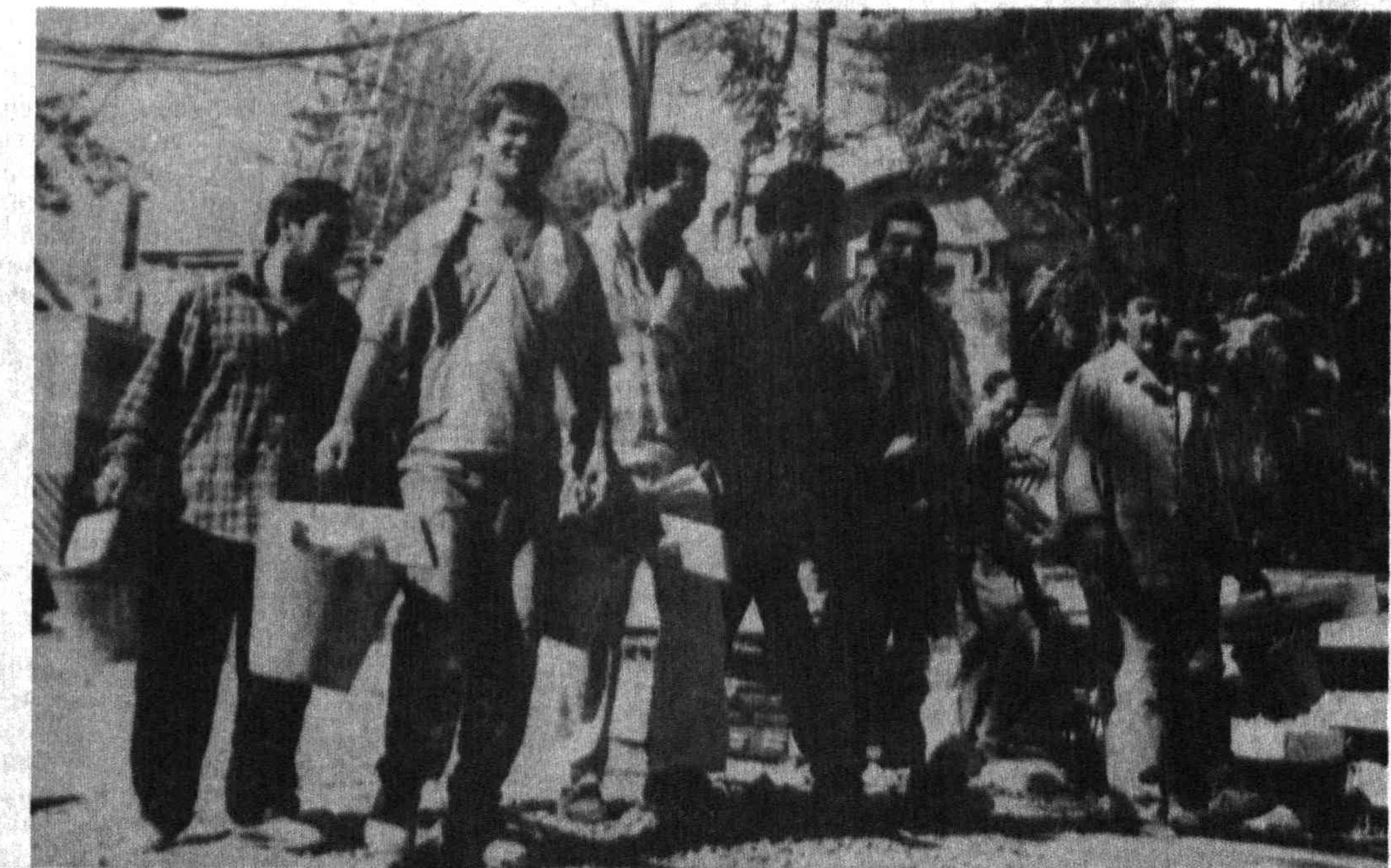
Мустақил юртимизнинг бинокорлари. СУРАТДА: «Тошмахсуспардозқурилиш» акционерлик жамиятининг 42-қурилиш бошқармаси сувоқчилар бригадаси.