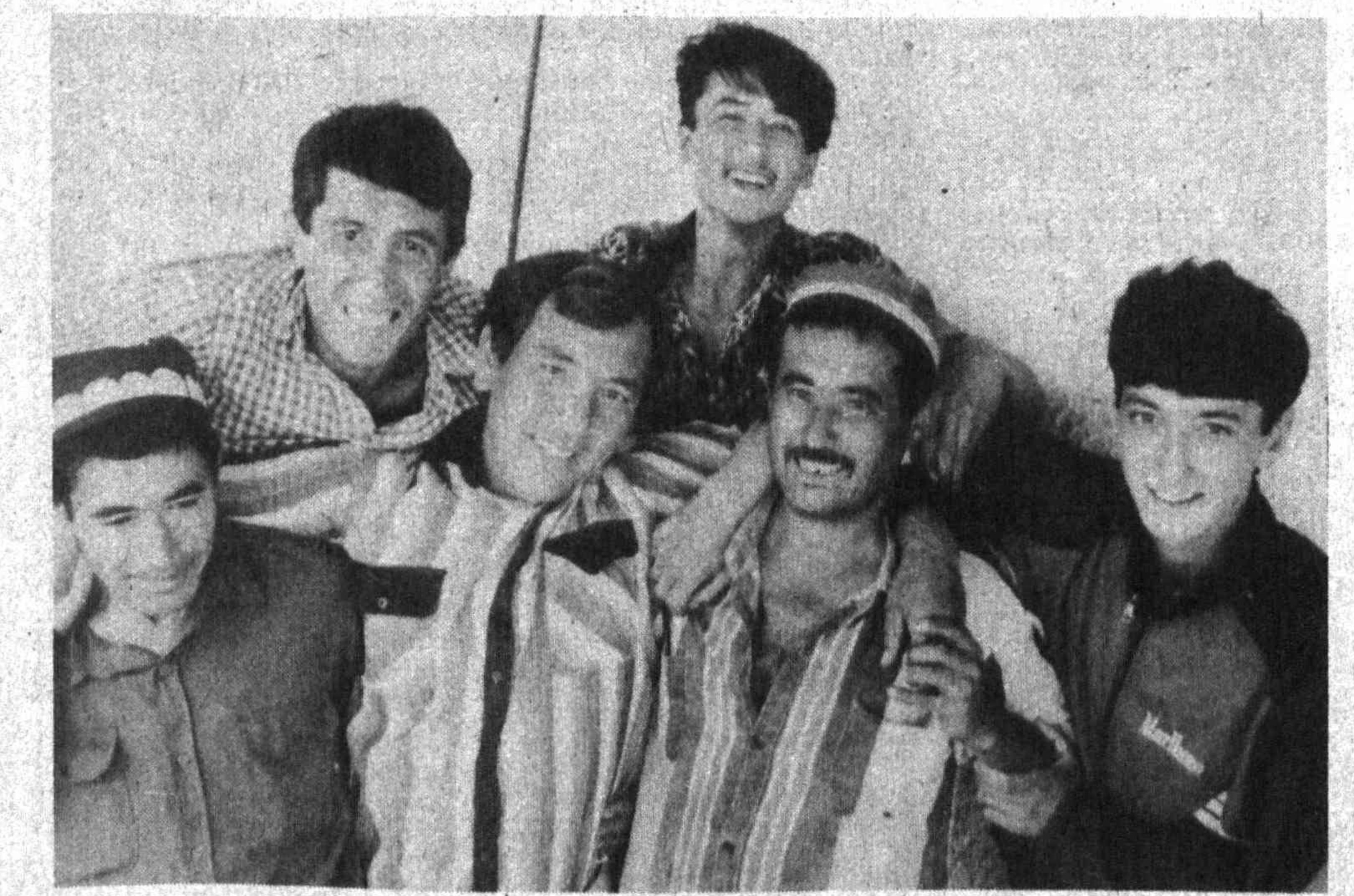
Тўрақўрғонлик ёшлар теримдан сўнг

валдан ҳам туманимиз тамал тошини фарғоналиклар қўйишган, улардан кўплари туманни, хўжаликларни бошқаришган. Биз водий ёшларини элимизга чорлайми!