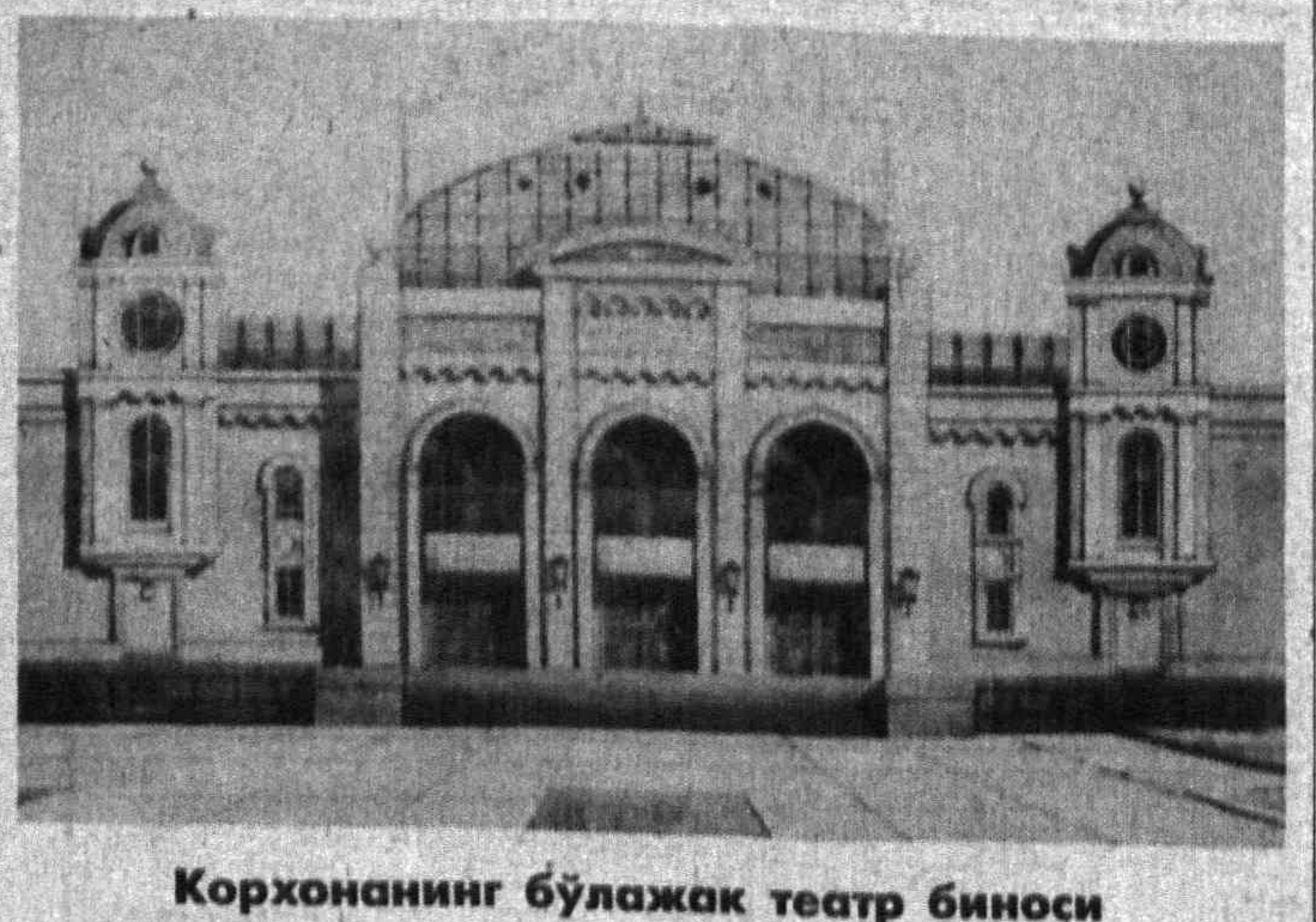
Корхонанинг бўлажак театр биноси