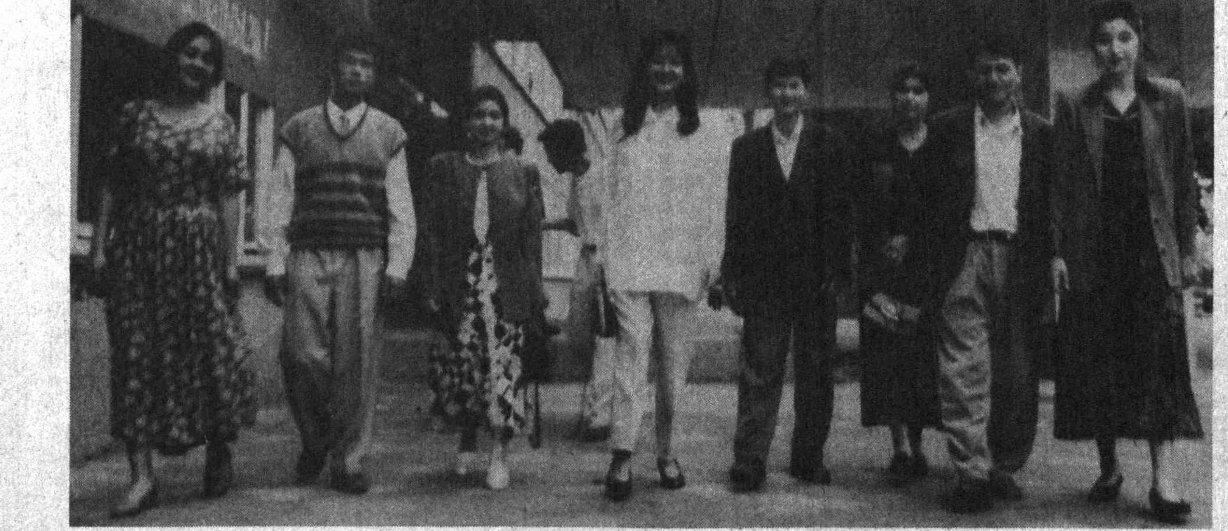
Суратда: тadbир иштирокчиларидан бир гуруҳи