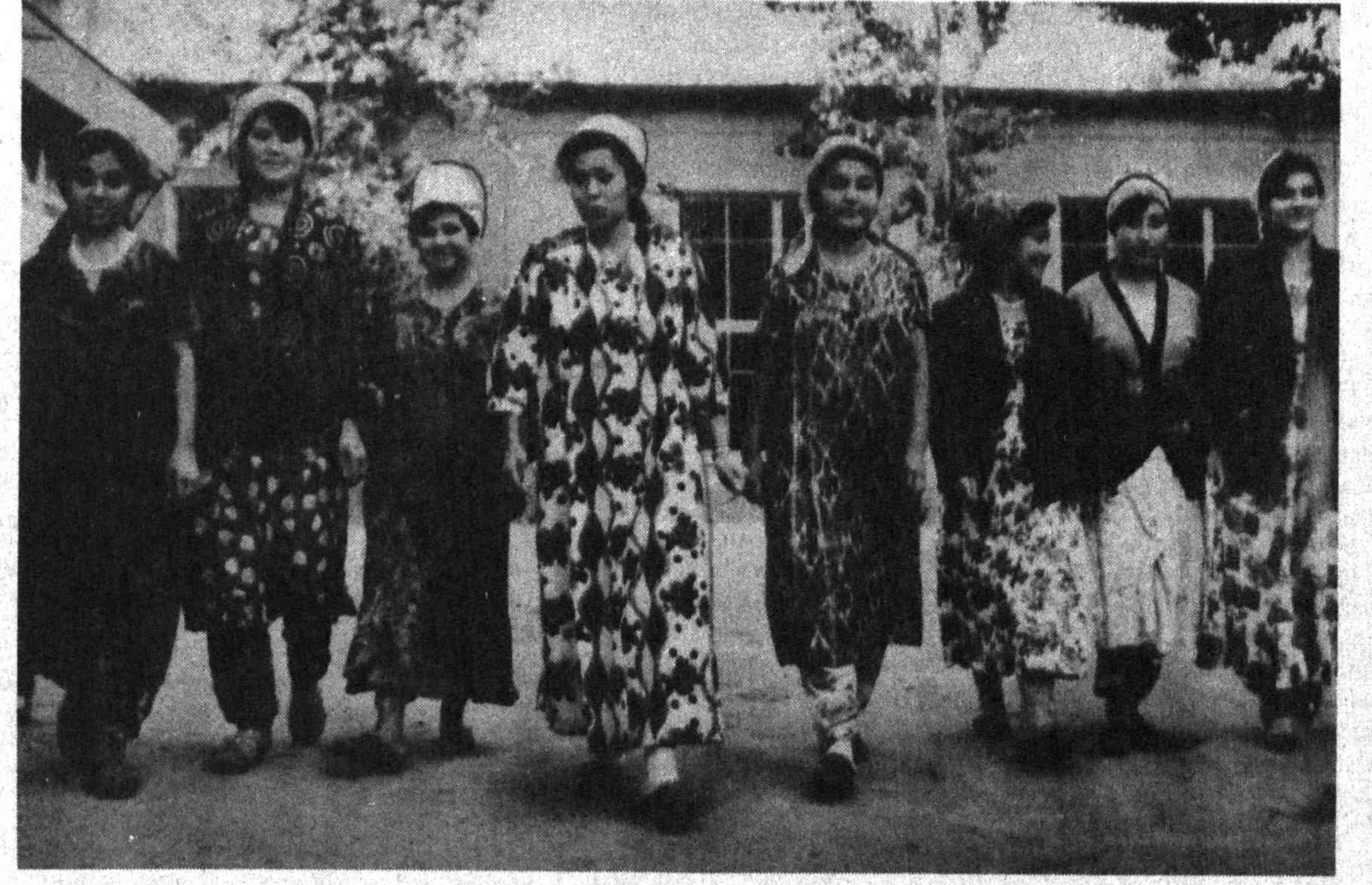
Шахрихондаги тўқимачилик ишлаб чиқариш бирлашмасининг бир гуруҳ чеварлари.