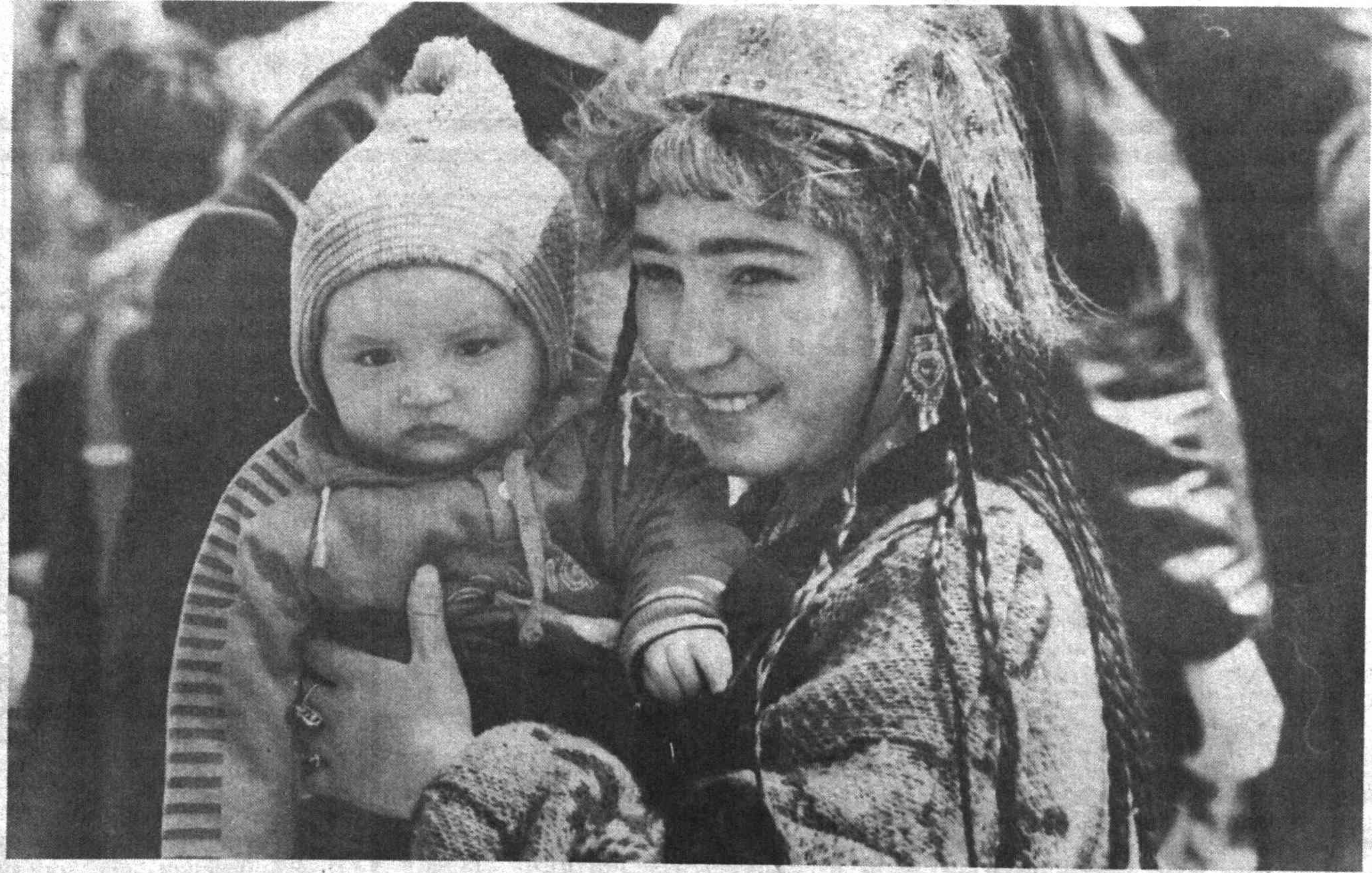
Келажак сенки, болақон!