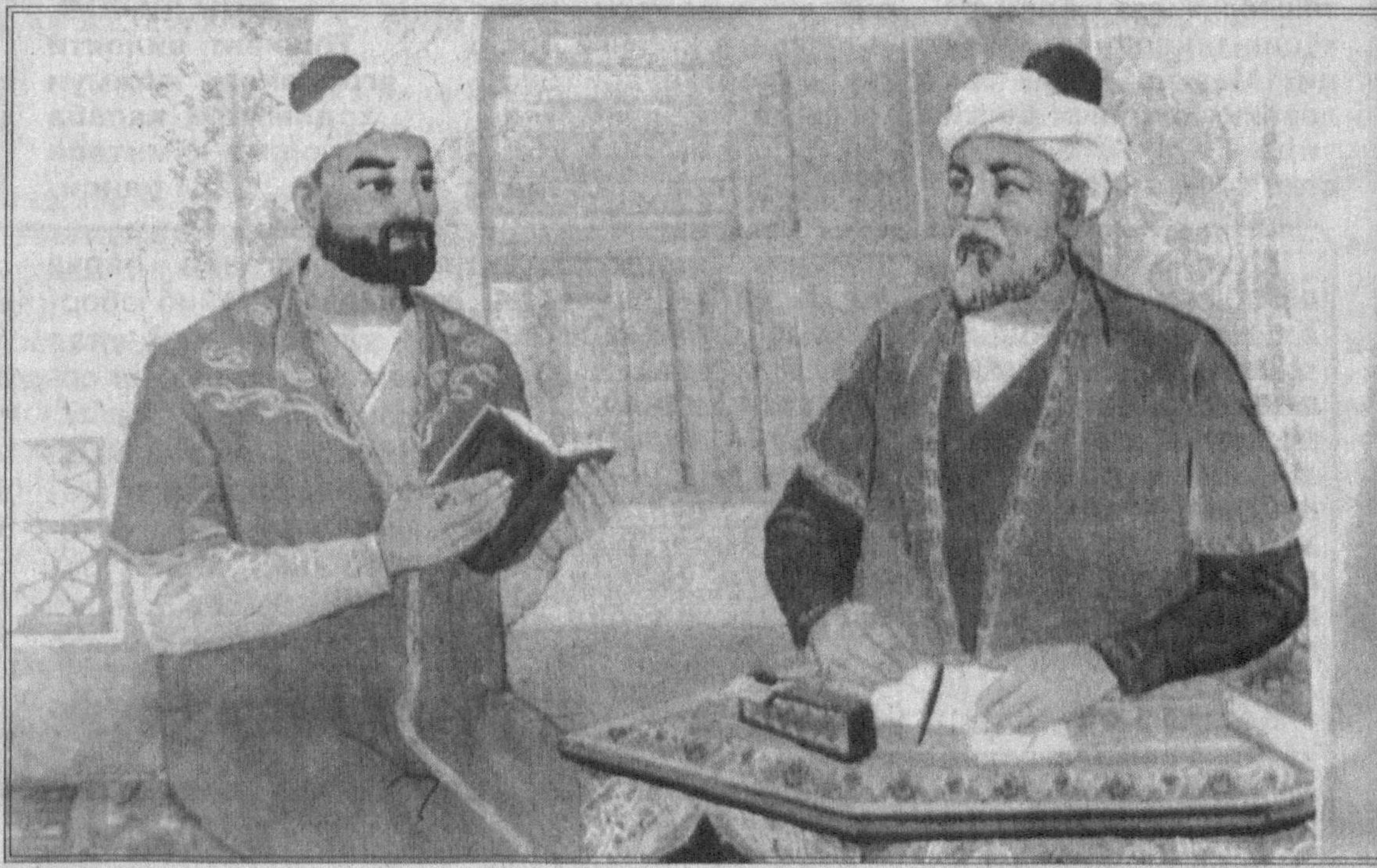
Икки пил ўлса Хусрав ё Низомий, Эрур юз пил чоғлиг пил Жомий.

Нолаю афгонинг, Эркин, дилбарингга етмади, Етса ҳам ё бемеҳр ёр зарра парво этмади, Битди кўп заҳминг ва лекин ишқ заҳми битмади, Эй Навоий, ишқ агар кўнглингни мажруҳ этмади, Бас, нединким қон келур оғзингдан, афгон айлагач.