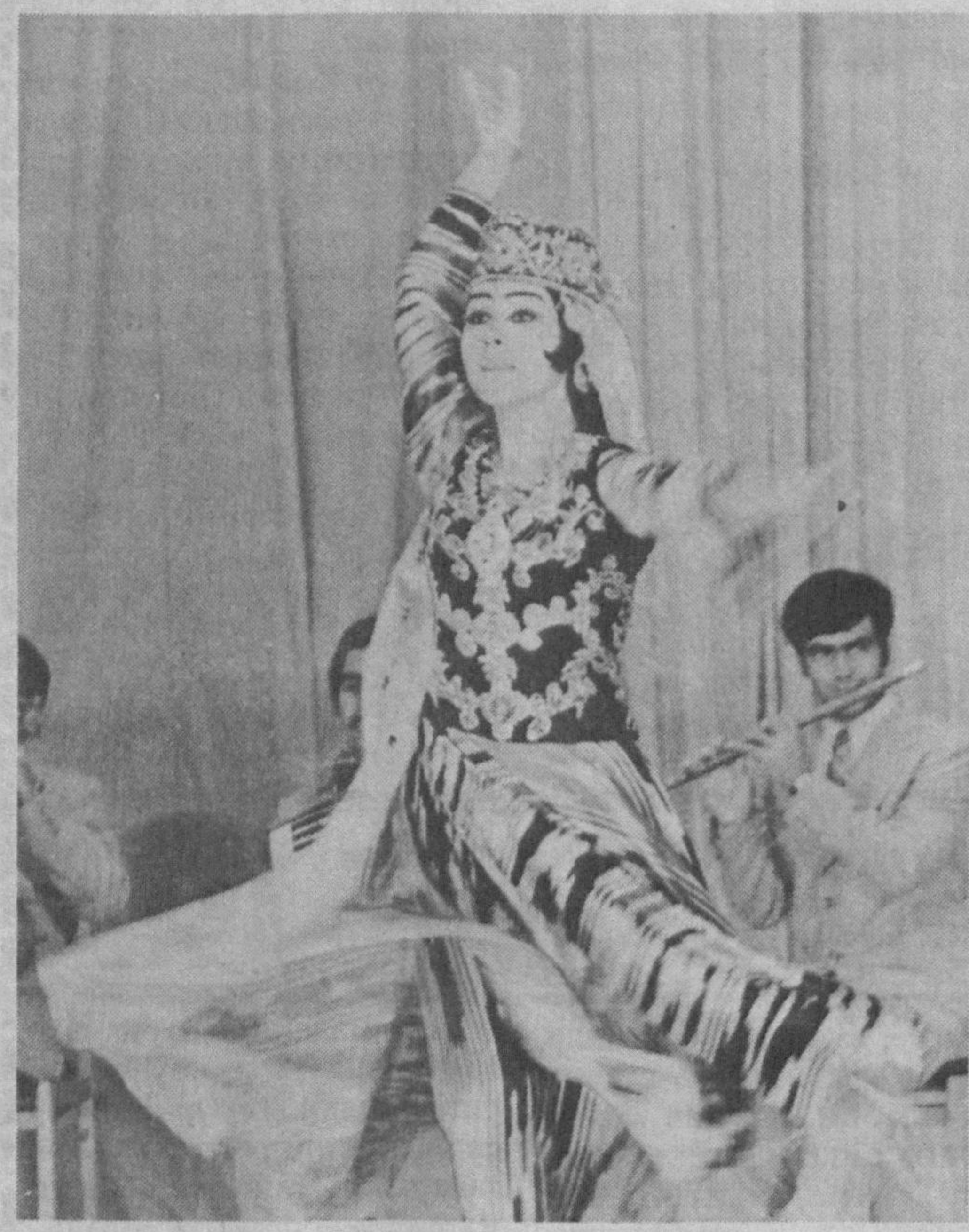
Рақсар — кўнгил изҳори...