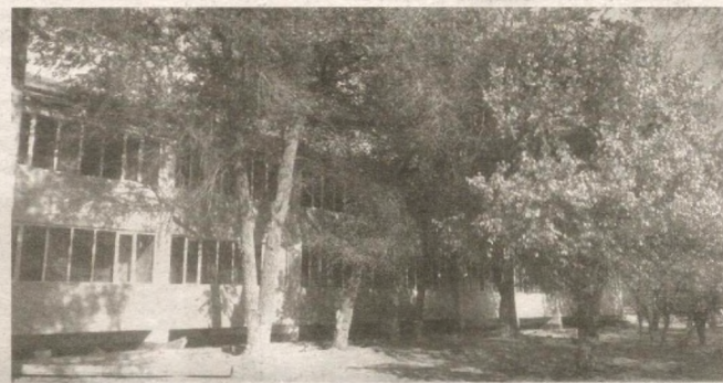
Государственная программа — в действии

Красивая и благоустроенная школа — гордость махаллы. Ученики бережно относятся к предоставляемым им оборудованию и принадлежностям. Свободное от занятий время ребята вместе с учителями проводят в теплицах, ухаживают за плодовыми деревьями, помогают в благоустройстве территории школы.