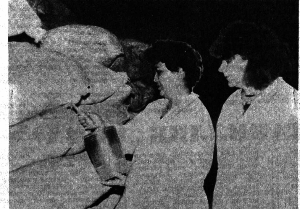
• Долзарб мавзу