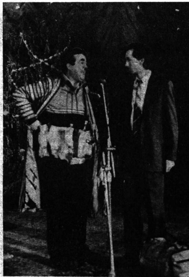
АНЪАНАГА кўра Ўзбекистон ойнаи жаҳон жамоаси ходимлари Янги йил оқшомида ўз мухлисларига яхши кайфият ва байрамона руҳ бахш этиш мақсадида мусиқали ҳазил-мутойбага бой кўрсатув тайёрлашмоқда. Яқинда бу кўрсатув Калинин ноҳиясидаги Алишер Навоий номи жамоа хўжали...