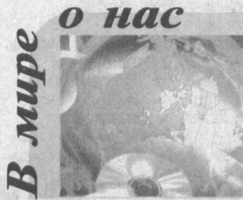
В мире о нас