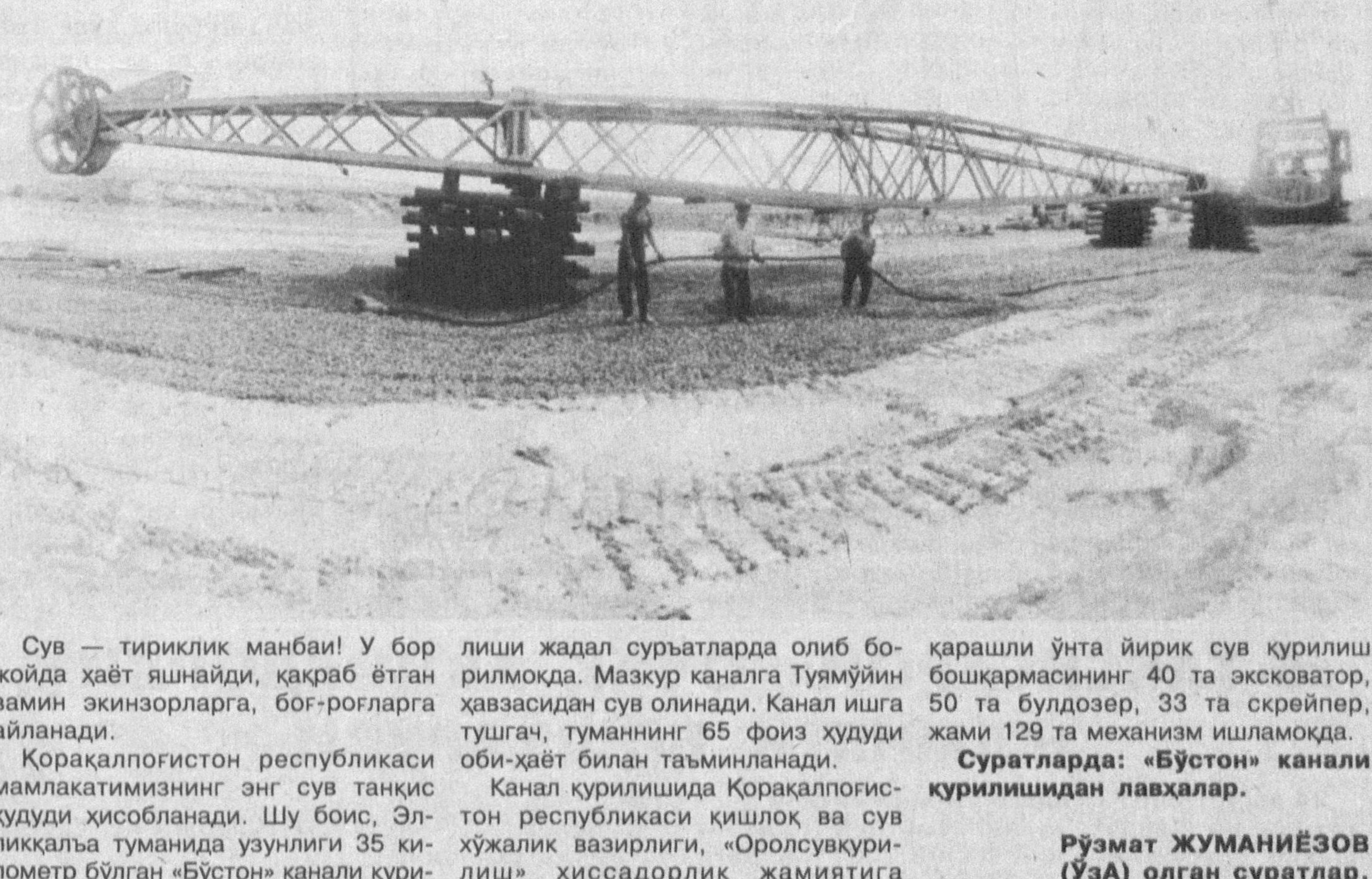
Сув — тириклик манбаи! У бор жойда ҳаёт яшайди, қақраб ётган замин экинзорларга, боғ-роғларга айланади. Қорақалпоғистон республикаси мамлакатимизнинг энг сув танқис ҳудуди ҳисобланади. Шу боис, Эллиқалъа туманида узунлиги 35 километр бўлган «Бўстон» канали қури-