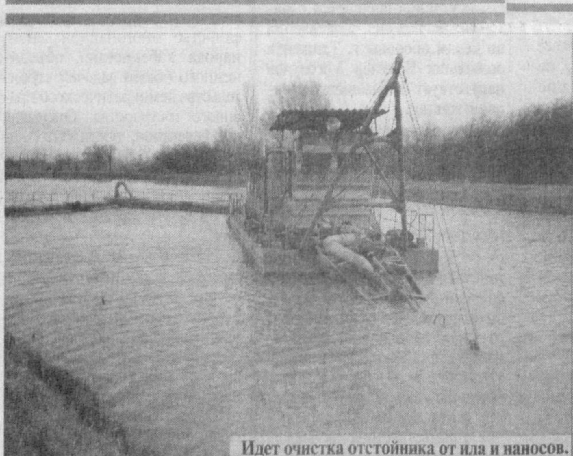
Идет очистка отстойника от ила и наносов. Как готовится питьевая вода для Ташкента, в каких объемах, как избежать перебоев с ее подачей горожанам сегодня и в перспективе? Эти вопросы - из редакционной почты. Чтобы ответить на них, отправляемся к производителю - в трест "Сувсос".