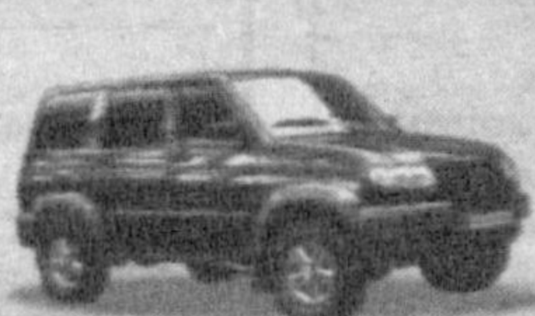
UAZ Patriot Comfort

Телефоны/факсы: 149-33-69, 150-20-43. Адрес: г. Ташкент, ул. Беруни, 83.