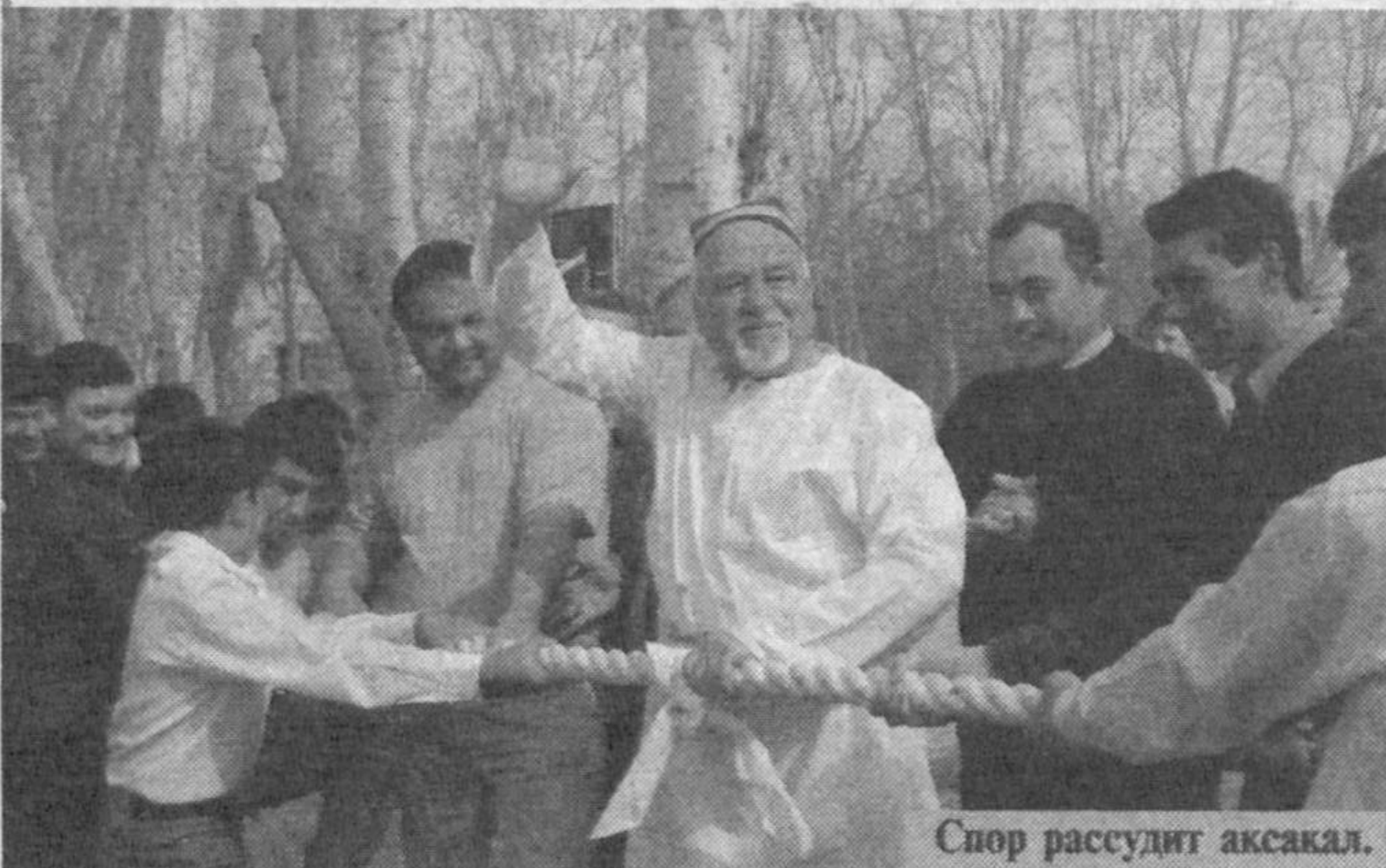
Спор рассудит аксакал.

Махалля... Для каждого жителя Узбекистана слово это звучит особо: трепетно, ласково, проникновенно. Махалля - это наш дом, место, где живут и общаются наши семьи, растут дети, питают нас мудростью старики. Махалля - не просто район, объединяющий жителей определенного участка города, это совместные радости, трудности, успехи и переживания. А еще махалля - это люди. Близкие, безмерно дорогие сердцу, готовые придти на помощь, поддержать в трудную минуту, успокоить, утешить.