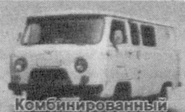
Комбинированный УАЗ-3909 фермер