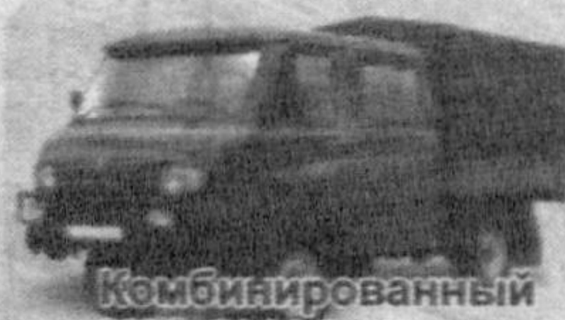
Комбинированный УАЗ-39094 фермер