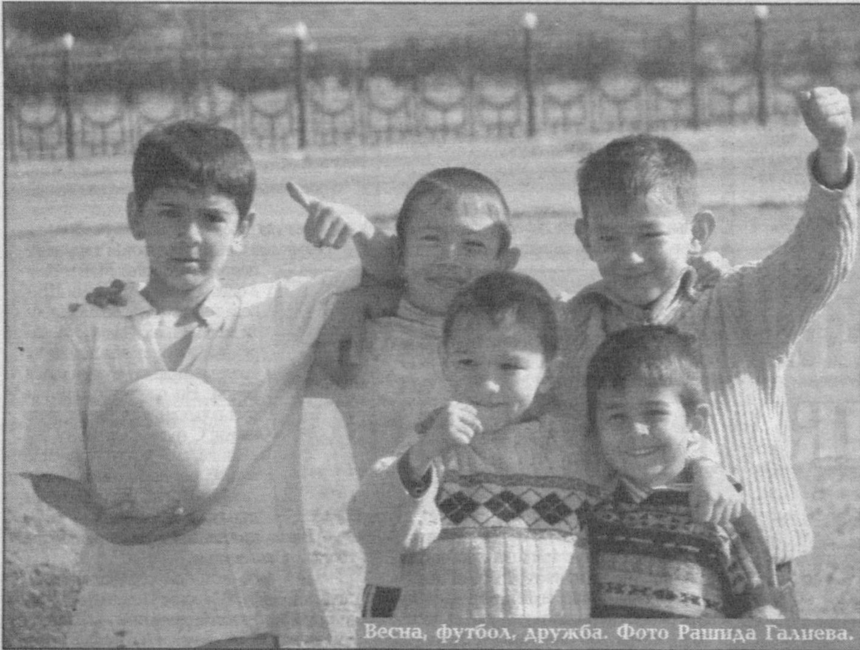
Весна, футбол, дружба.