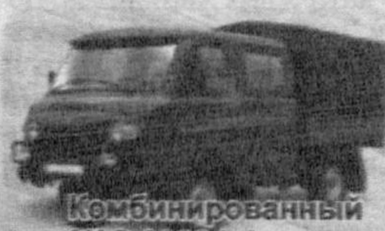
Комбинированный УАЗ-39094 фермер