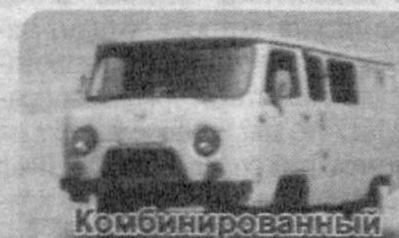
Комбинированный УАЗ-3909 фермер