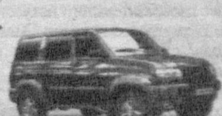
UAZ Patriot Comfort

Телефоны/факсы: 149-33-69, 150-20-43. Адрес: г. Ташкент, ул. Беруни, 83.