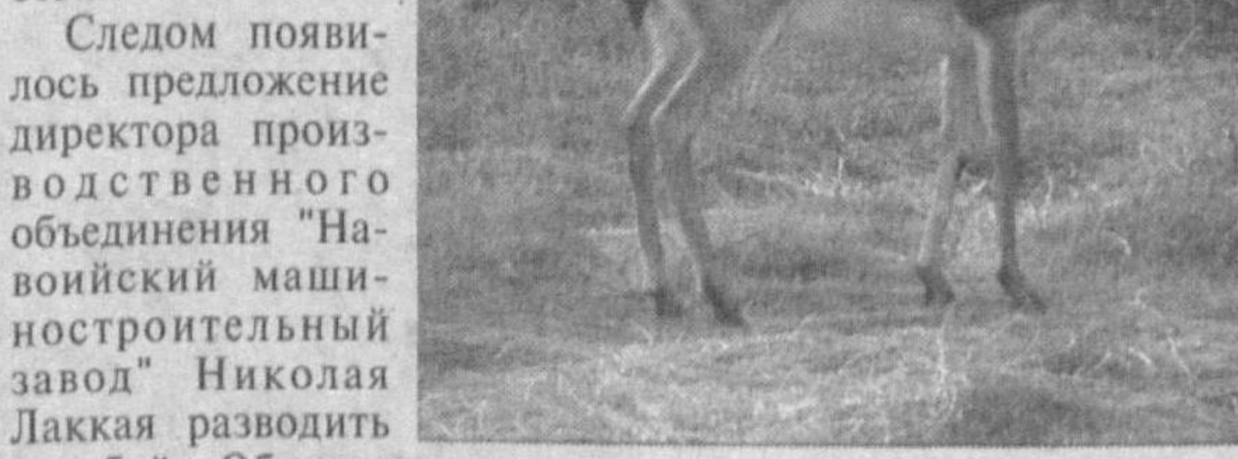
джейраны обитают в специальном загоне. Перепелки, кеклики, фазаны - в летних вольерах. Страус "окупирует" территорию "японского сада", возле которого построен специальный домик для голубей. Лошади, гуси, павлины, индейки здесь гуляют свободно.

Виктор Минько. Фото автора. Навоийская область.