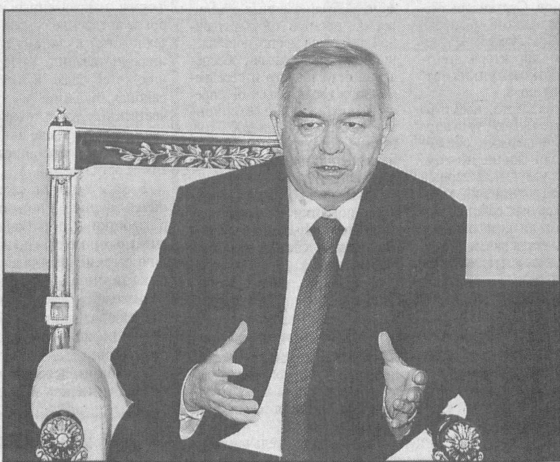
Глава государства отметил, что в ходе предстоящих в Каире встреч предусмотрено обсуждение вопросов расширения узбекско-египетского сотрудничества, а также актуальных международных проблем.

Между нашими странами подписаны двадцать четыре документа на различных уровнях. В ходе визитов официальных делегаций двух стран укрепляется правовая основа сотрудничества.