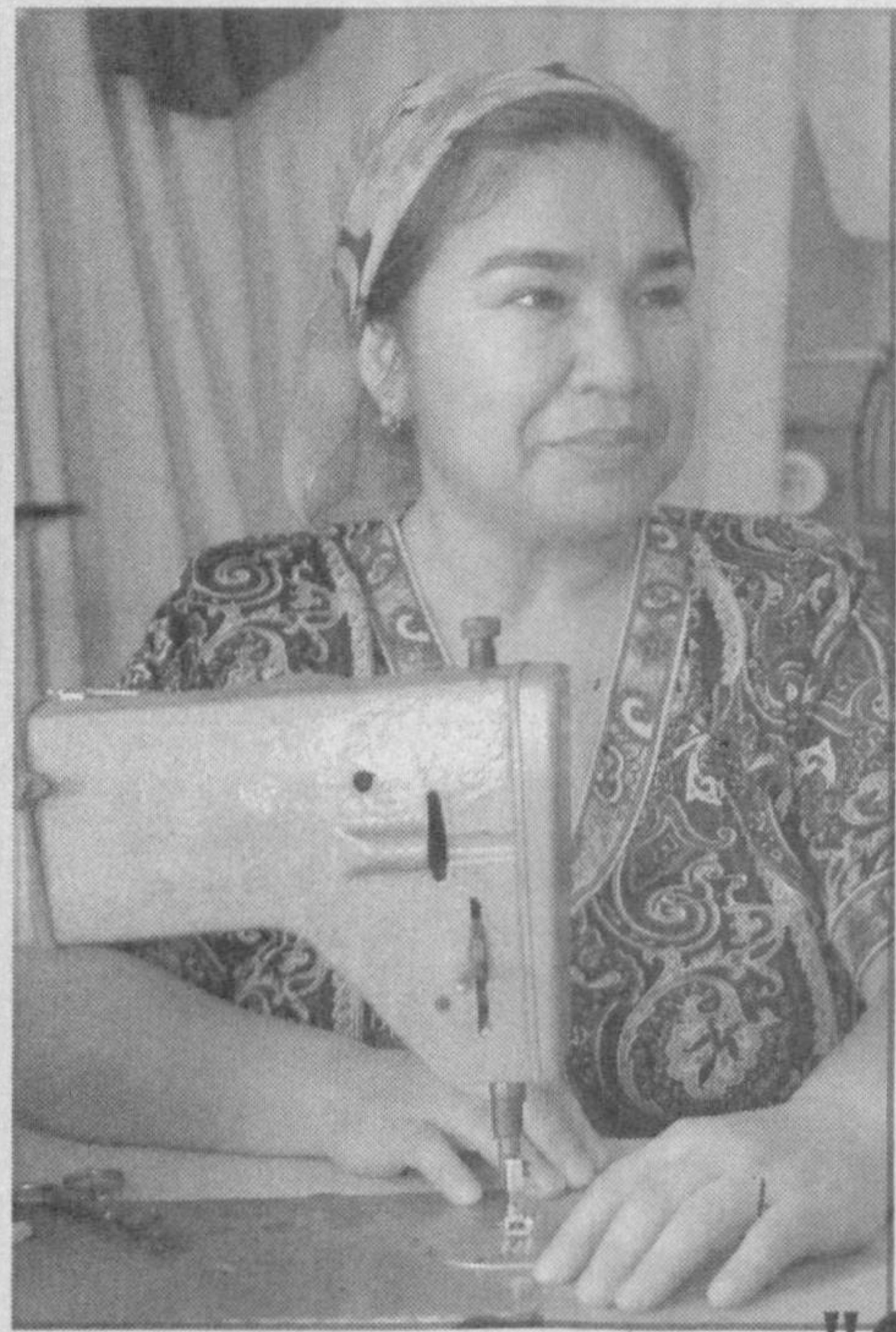
Производственный кооператив "Олимп", расположенный в махалле Самарканд дарвоза Шайхантахурского района, обрел еще одного крупного заказчика на производимую продукцию в лице Национальной холдинговой компании "Узбекнефтегаз".

Пресс-служба Сената Олий Мажлиса Республики Узбекистан.