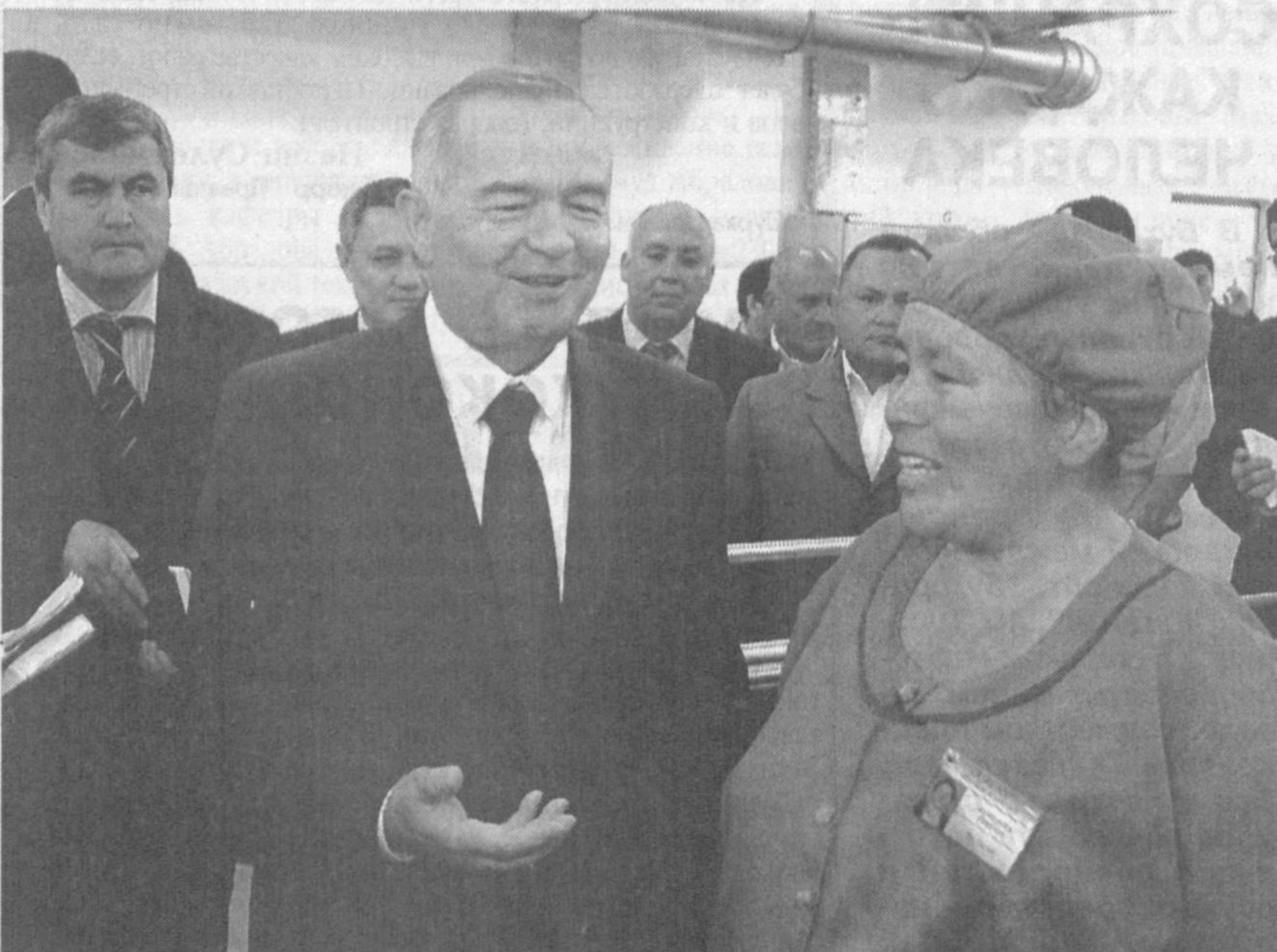
Как сообщалось ранее, Президент Республики Узбекистан Ислам Каримов в целях ознакомления с ходом социально-экономических реформ, осуществляемой на местах производственной работой 17-18 мая посетил Республику Каракалпакстан и Хорезмскую область.

Глава государства ознакомился с производственной работой, осуществляемой на центральной площади города Ургенч, побеседовал с авторами проекта реконструкции, строителями и инженерами. Исходя из местных почвенных и климатических условий он дал необходимые рекомендации по превращению площади в зеленую зону. Второй день поездки Президент Ислам Каримов начал с посещения недавно реконструированного предприятия акционерного общества "Гурлан" Гурленского района. Хорезмская область обладает большим потенциалом не только в аграрной, но и промышленной сфере. Сегодня в оазисе функционируют около сорока промышленных предприятий,