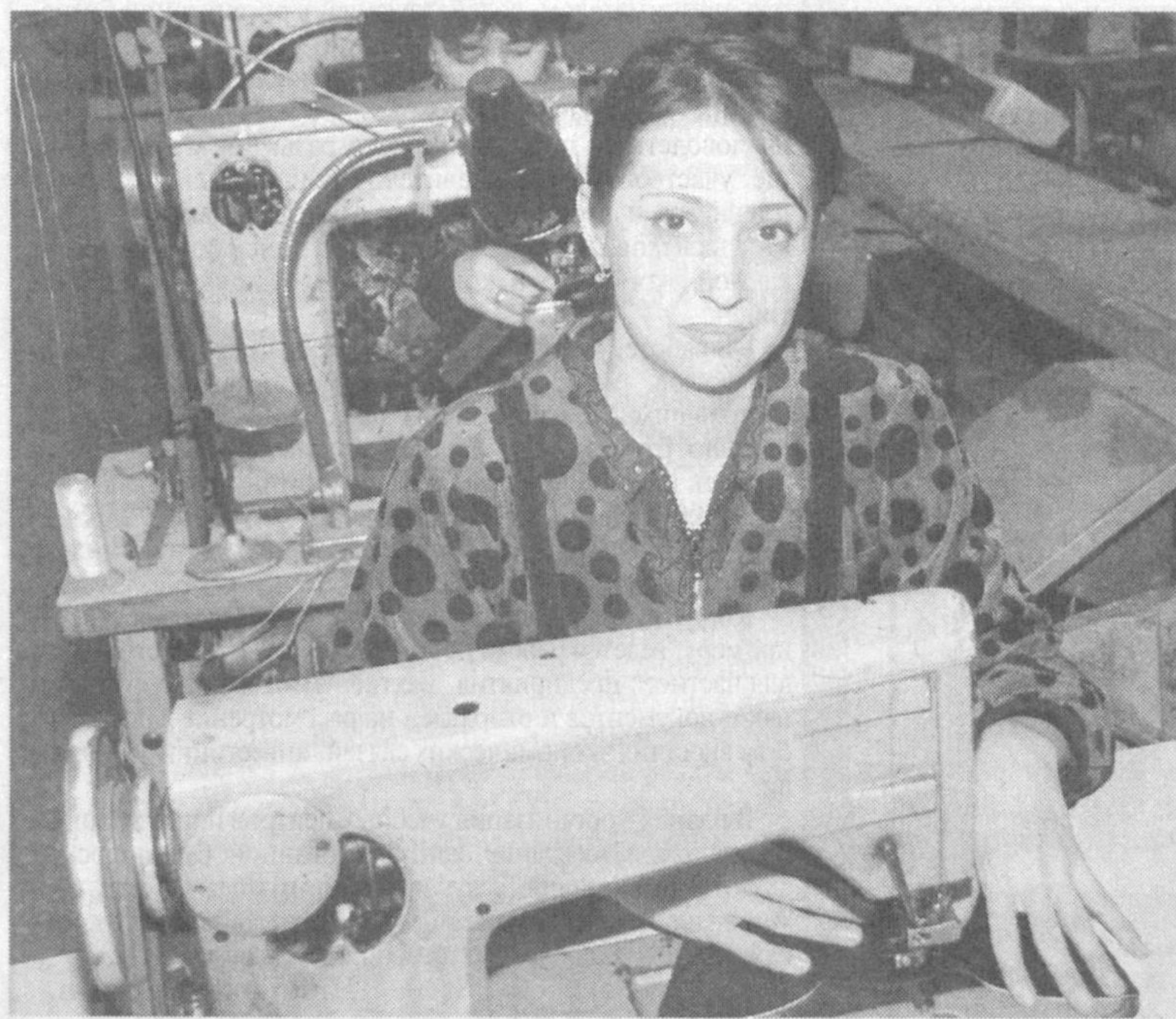
К 2000 - ЛЕТИЮ МАРГИЛАНА