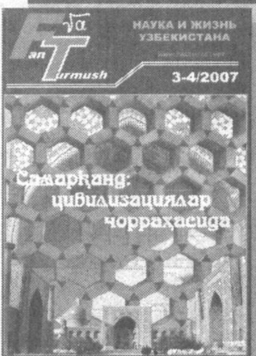
Вышел очередной - объединенный № 3-4 журнала "Наука и жизнь Узбекистана". Предлагаем вниманию читателей две его публикации.

наследовал сын Джахонгир-шаха - Шах Джахан. Проставлена также дата, соответствующая 1646 году. В настоящее время нефритовая чаша Улугбека является частной собственностью и экспонируется в Музее Гулбенкяна в Лиссабоне (Португалия). Она была приобретена им на аукционе Кристи в Лондоне в 1927 году. Чаша изготовлена из бело-голубого нефрита - са-