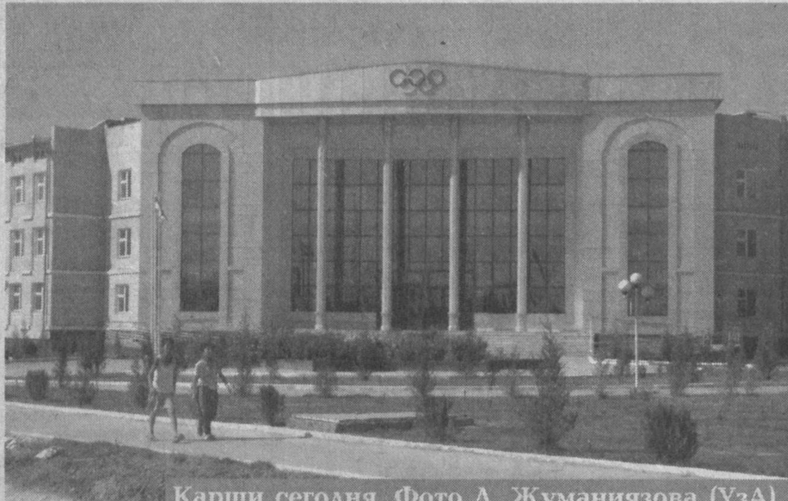
Карши сегодня.

Web-site: www.ogutrade.uz, www.dgmarket.uz, www.slant.ru E-mail: tmarketing@mail.ru, import-tender@yandex.ru