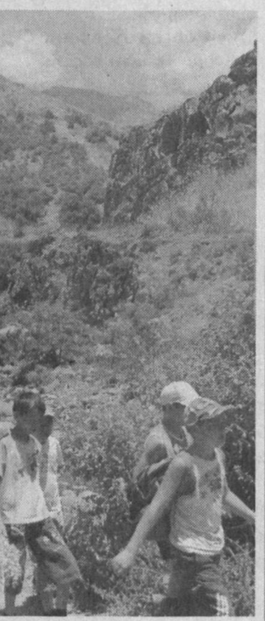
В поход по родному краю.