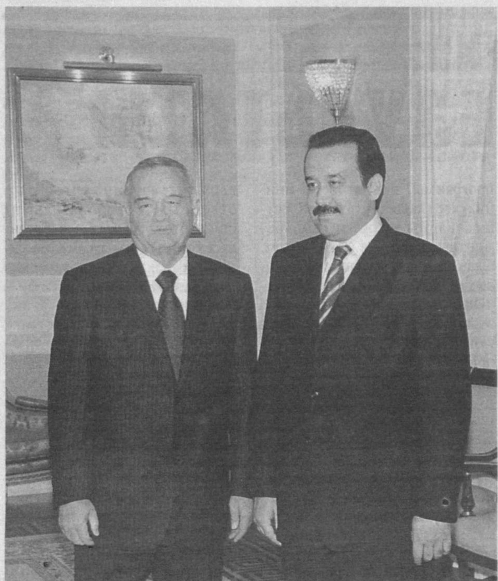
Президент Республики Узбекистан Ислам Каримов 26 июля принял в резиденции Оксарой Премьер-министра Республики Казахстан Карима Масимова.

УЧРЕДИТЕЛЬ - КАБИНЕТ МИНИСТРОВ РЕСПУБЛИКИ УЗБЕКИСТАН