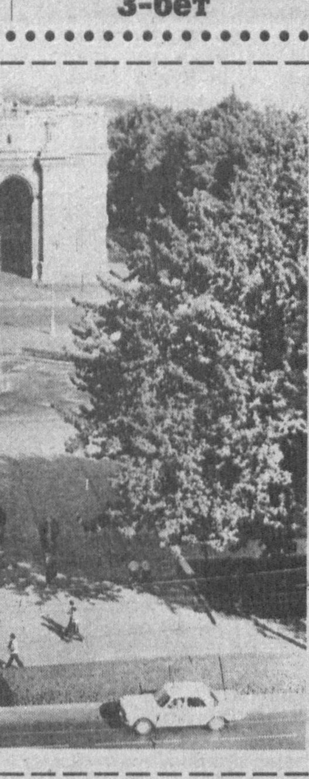
руҳига мос тарзда, шарқона тарбия асосида бозор иқтисодиёти ҳамда сайёҳлик фаолияти учун устивор аҳамиятга эга бўлган йўналишлар бўйича маънавий мутахассислар таъйинлашга қаратилмоғи лозим. Институт қошида маданият ва туризм академик лицейи ташкил этиш янада долзарб бўлиши керак бўлади.

Учинчидан, маданият ва сайёҳлик соҳаларидаги бақаларият ва магистратура бўйича давлат таълим стандартларини ишлаб чиқиш, юқори маънавий кадрлар таъйинлашга қодир етук профессор-ўқитувчилар таркибининг шакллантириш лозим.