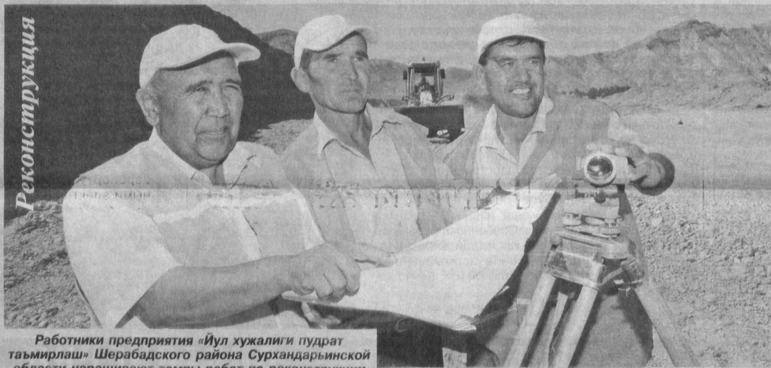
Работники предприятия «Йул хужалиги пудрат таъмирлаш» Шерабадского района Сурхандарьинской области наращивают темпы работ по реконструкции пятикилометрового отрезка автомагистрали «Алматы — Бишкек — Ташкент — Термез».

В рамках проекта «Узбекская национальная автомагистраль», разработанного на основании постановления Президента страны от 22 апреля текущего года, автотрасса М-39 была переведена в первую категорию, что предопределило необходимость ее реконструкции в соответ-