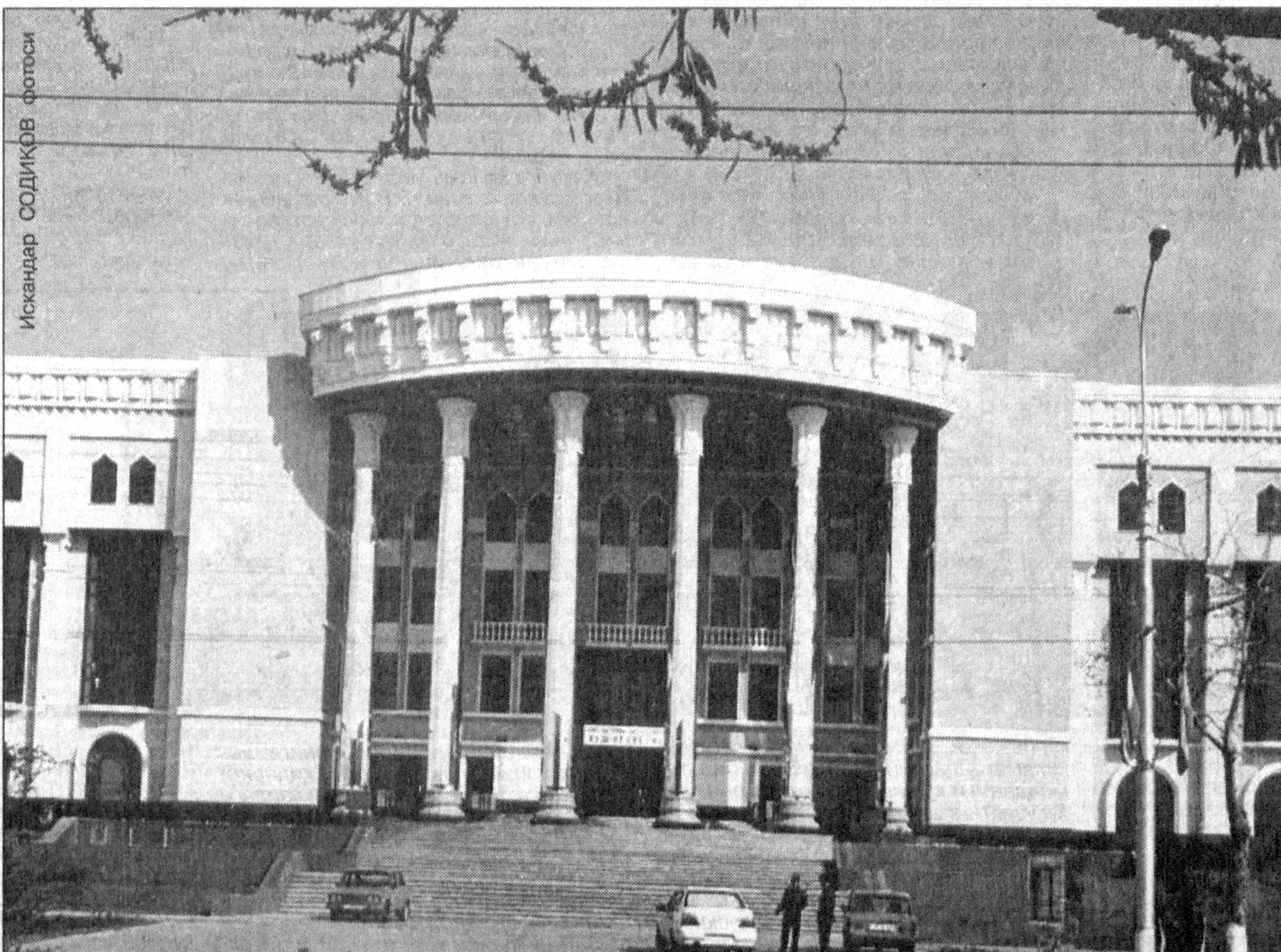
Ўзбекистон Давлат консерваторияси иқтидорлар маскани бўлади!..

26 мартда Ислам Каримов Республика шойлинич тиббий хизмат илмий марказига ташриф буюриб, муассаса фаолияти билан танишди. — Биз тиббиёт соҳасидаги ислохотларнинг илк босқичини яқунлашмиз, — деди Юртбошимиз. — Кейинги босқичда ихтисослашган тиббий муассасалар фаолиятини йўлга қўйиш диққат-эътиборимизда бўлади. Бу каби марказлар аҳоли саломатлигини янада яхшилашга, малакали тиббий хизмат кўрсатилишида салмоқли ҳисса қўйиши шубҳасиздир.