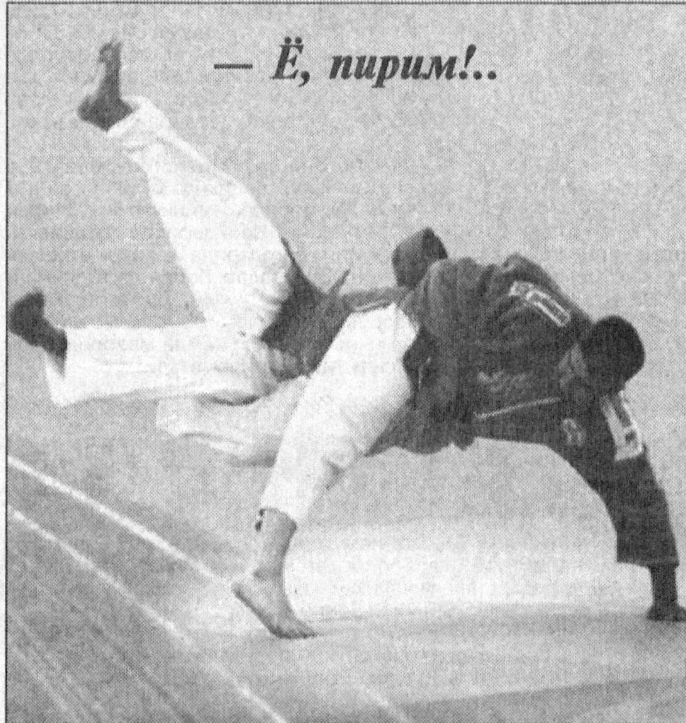
— Ё, пирим!..

Яқинда Ўзбекистоннинг Германия Федератив Республикасидаги элчихонаси ташаббуси билан Берлин шаҳрида Халқаро кураш ассоциацияси (ЖКА) илк бор немис халқига кураш бўйича курғазмали чиқишларни намойиш этди.