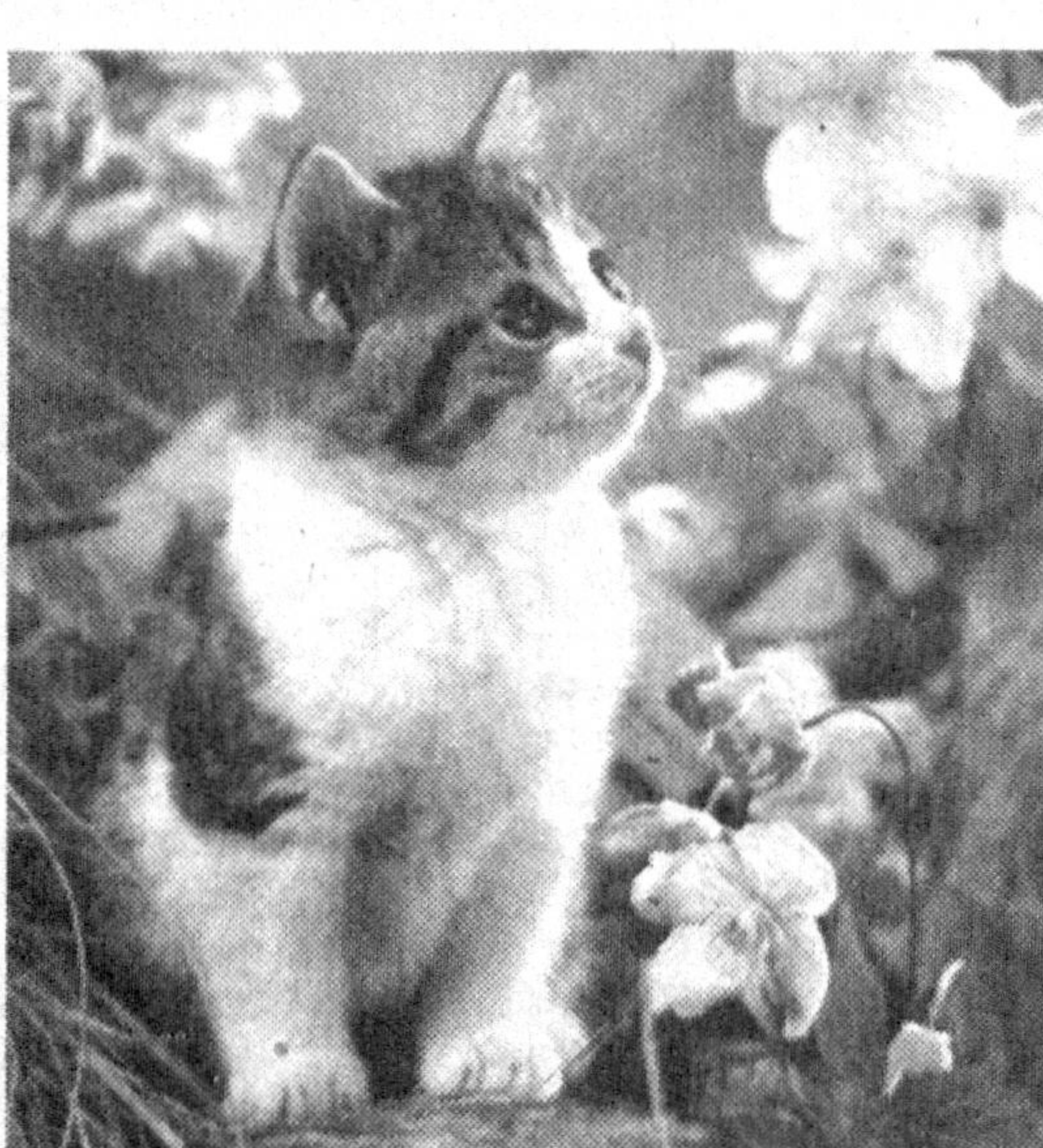
Жониворлар ичида инсоннинг энг яқин дўстини нима? Бу саволга кўпчилик хануз "ит", деб жавоб берса...