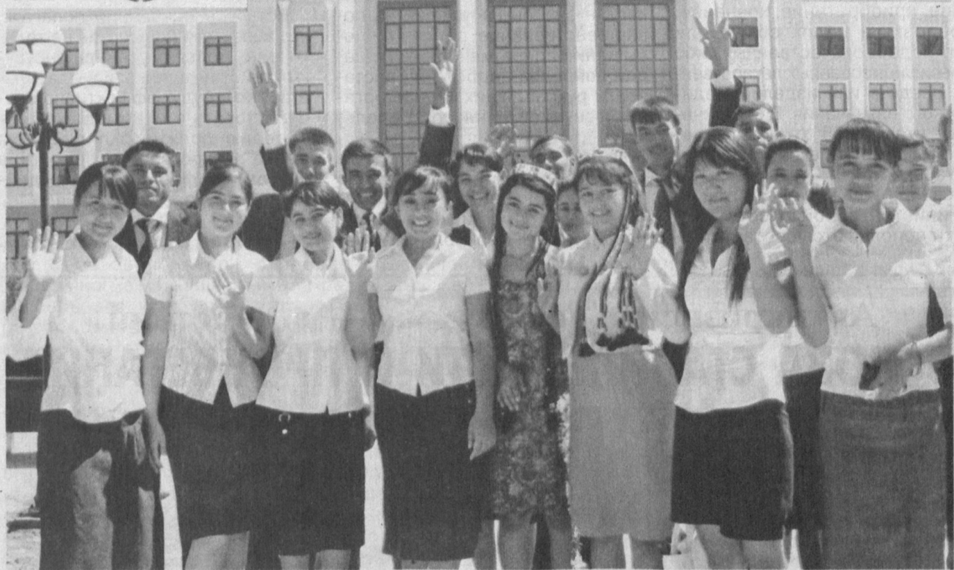
Грядущий праздник — День независимости студенты и профессорско-преподавательский состав Термезского государственного университета встречают с большим воодушевлением и приподнятым настроением, в полной мере ощутив заботу и внимание, проявляемые к ним со стороны главы государства.

В старейшем и единственном в южном регионе страны высшем учебном заведении, на девяти факультетах которого обучаются около восьми тысяч юношей и девушек, завершено строительство и оснащение нового учебного корпуса на 1 400 мест. В его просторных аудиториях, конференц-залах, учебно-лабораторных и методических кабинетах сегодня установлены самые новейшие технические средства обучения,