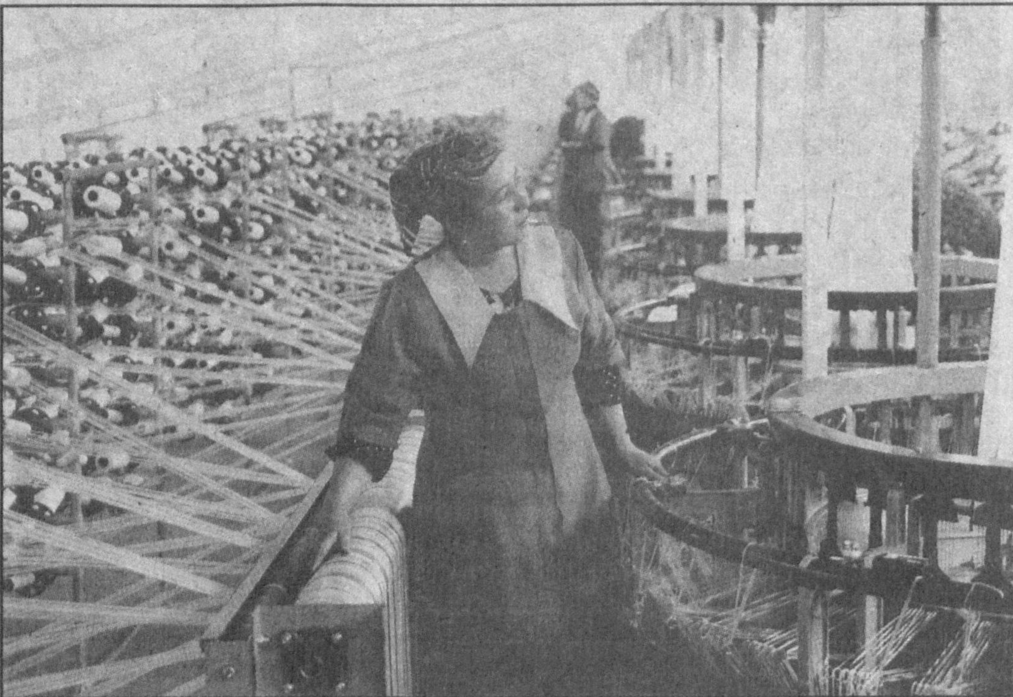
Чет эл сармоясини жалб этиш мамлакатимиз иқтисодини юксалтириш билан бирга кўплаб янги иш ўринлари яратилишида муҳим омил бўлмоқда. Жумладан, «Анджон полипропилен» Ўзбек-Америка қўшма корхонасида бугунги кунда 220 нафар ишчи-хизматчи икки сменада меҳнат қилмоқда. Корхонада ҳозир бир кунда минг тонна полипропилен тайёр-

ланаётир. Маҳсулот сифатли ва харидор-гир бўлгани боис Россия, Қозғистон, Украина ишбилармонлари унга кўплаб буюртма беришмоқда.