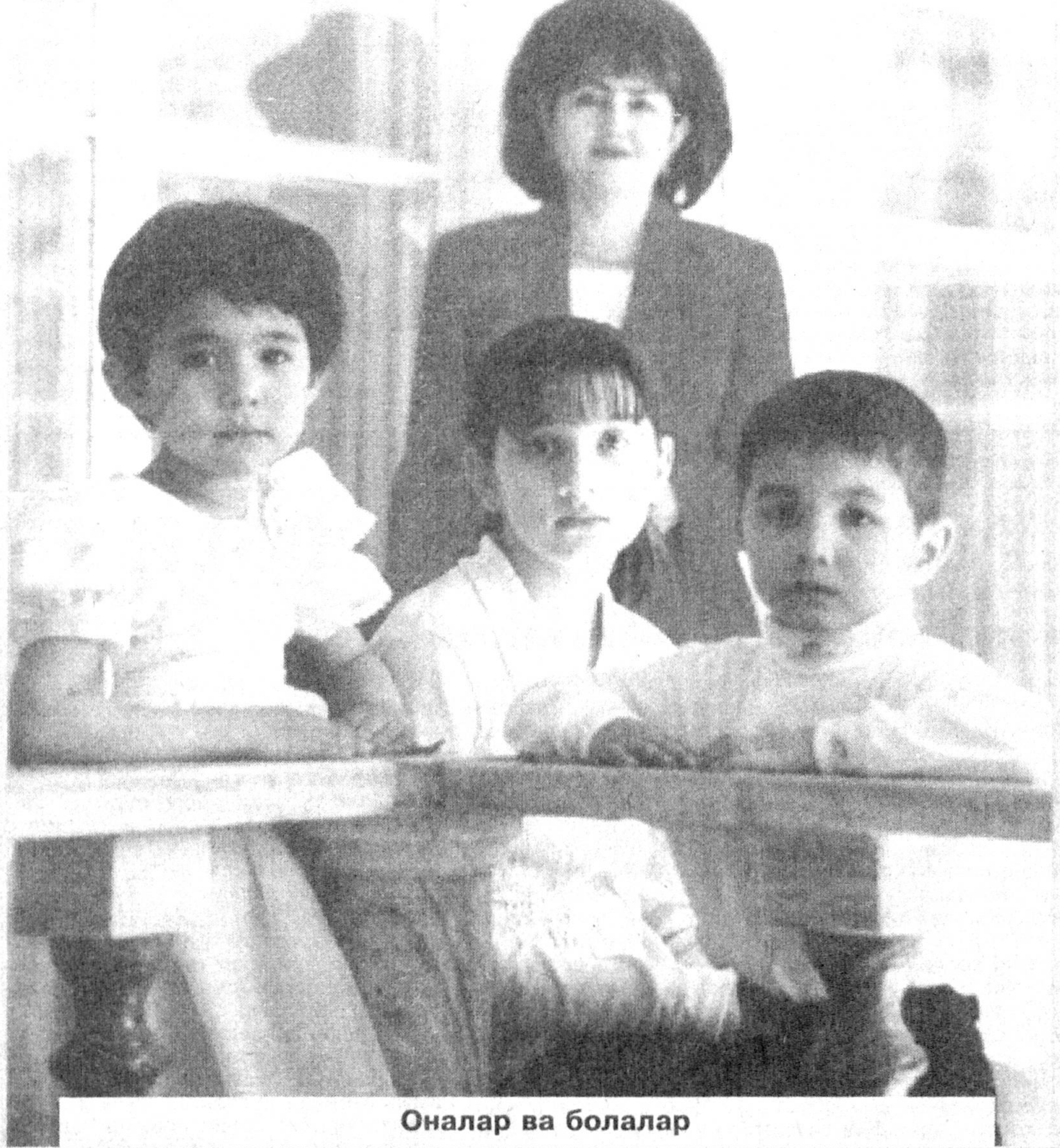
Оналар ва болалар