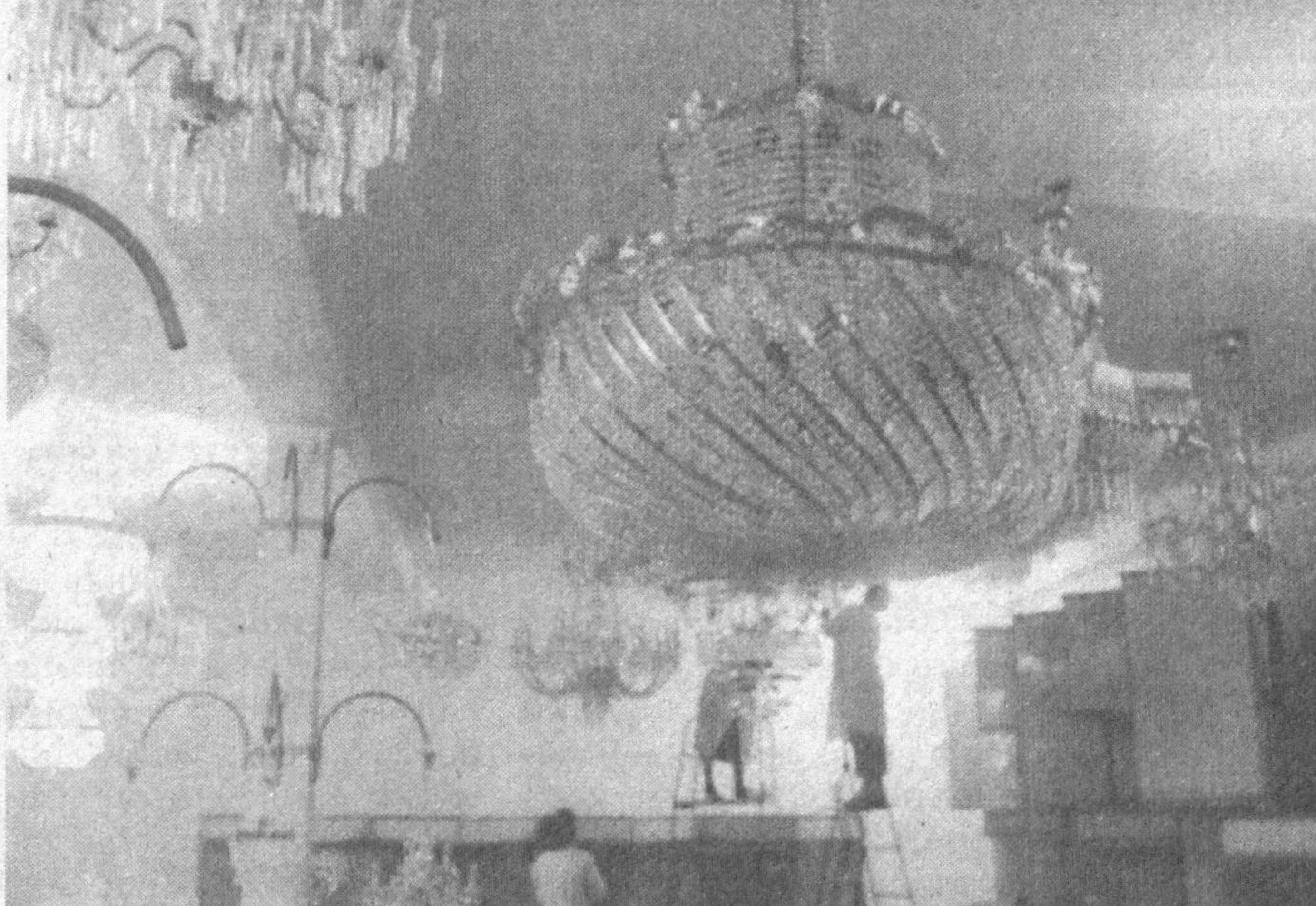
Тошкент шаҳрида жойлашган «ОНИКС» очиқ турдаги ҳиссадорлик жамиятида ишлаб чиқарилаётган қандил ва вазалар бугунги кунда нафақат мамлақати-мизда, балки хорижда ҳам харидорғир. Чунки маҳсу-