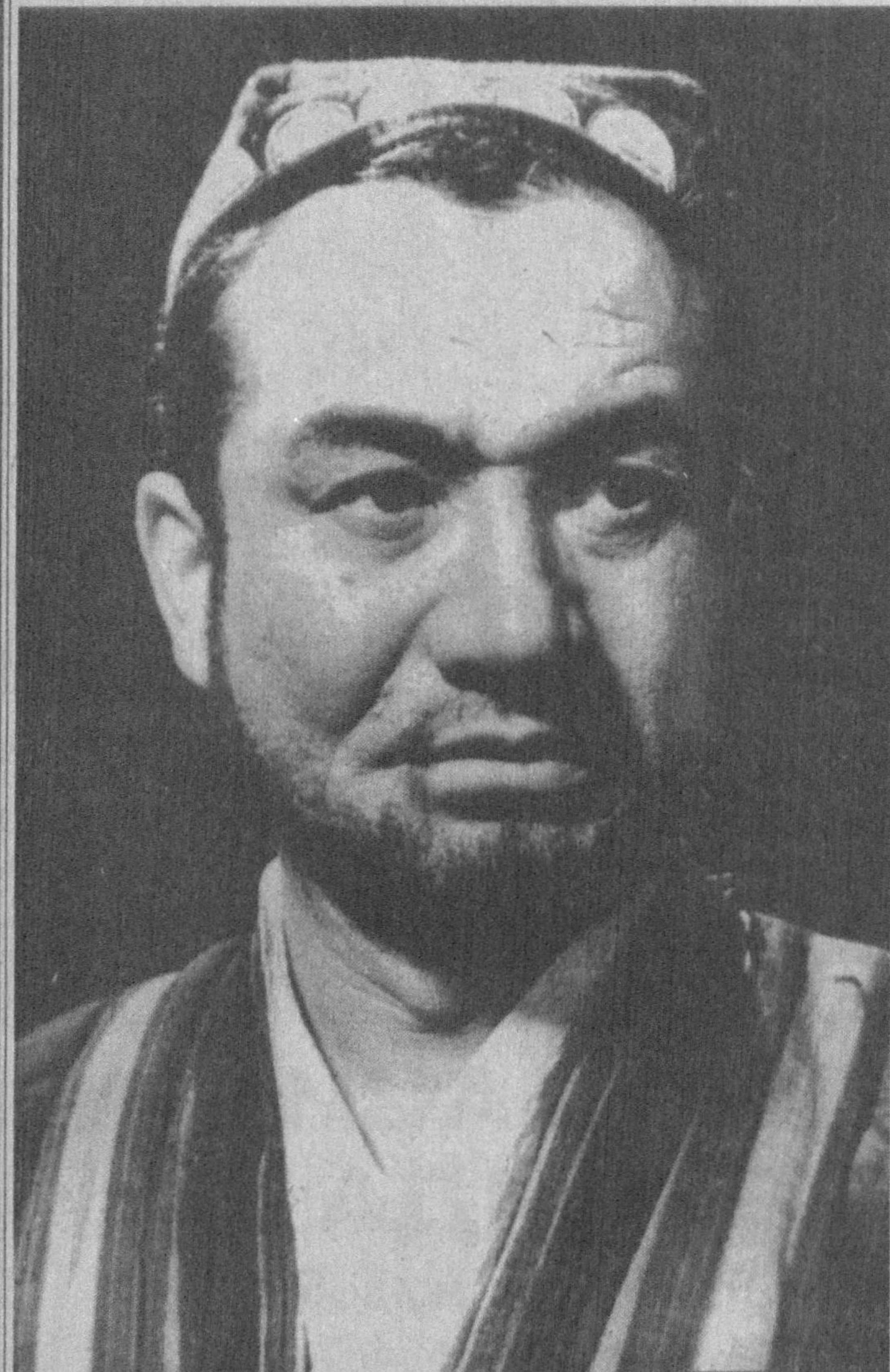
Шукур Бурхоннинг дўсти кўп, мухлислари сони эса беҳисоб эди. Баъзан ўзи ҳақида ёзилган шеърини машқларни шогирдларига ўқитиб, қўлимсираб ўтирарди. Шукур акага бефарқ қараган киши бўлмаган. Унинг чехрасидаги самимият, эхтирос, шижоат барчани бирдек ўзига мафтун этарди.

Ўша дамда биринчи учрашувда уйғонган қизиқни артист Шукур Бурхон сахнадан, экрандан, кези келганда ўзаро суҳбатда «қониқтириб», «кучайтириб» борарди. Атайлаб эмас. Унинг табиати, ижрочилик истеъдоди шуни тақозо этарди. Унинг Хамлетини кўрганлар театрга қайта-қайта келиб, шаҳзоданинг кечинмалари, ўйлари, дардлари билан яна бир бор танишмоқчи бўлардилар. Актёр уларда ҳар гал завок, теран фикр уйғотар, шу боис катта гудасталар билан уйга қайтганида олқишларни, гулдирос қарсақларни эшитиб тургандек бўларди. Биз эса унинг уйига қайтганида олқишларни, гулдирос қарсақларни эшитиб тургандек бўларди. Биз эса унинг уйига қайтганида олқишларни, гулдирос қарсақларни эшитиб тургандек бўларди.