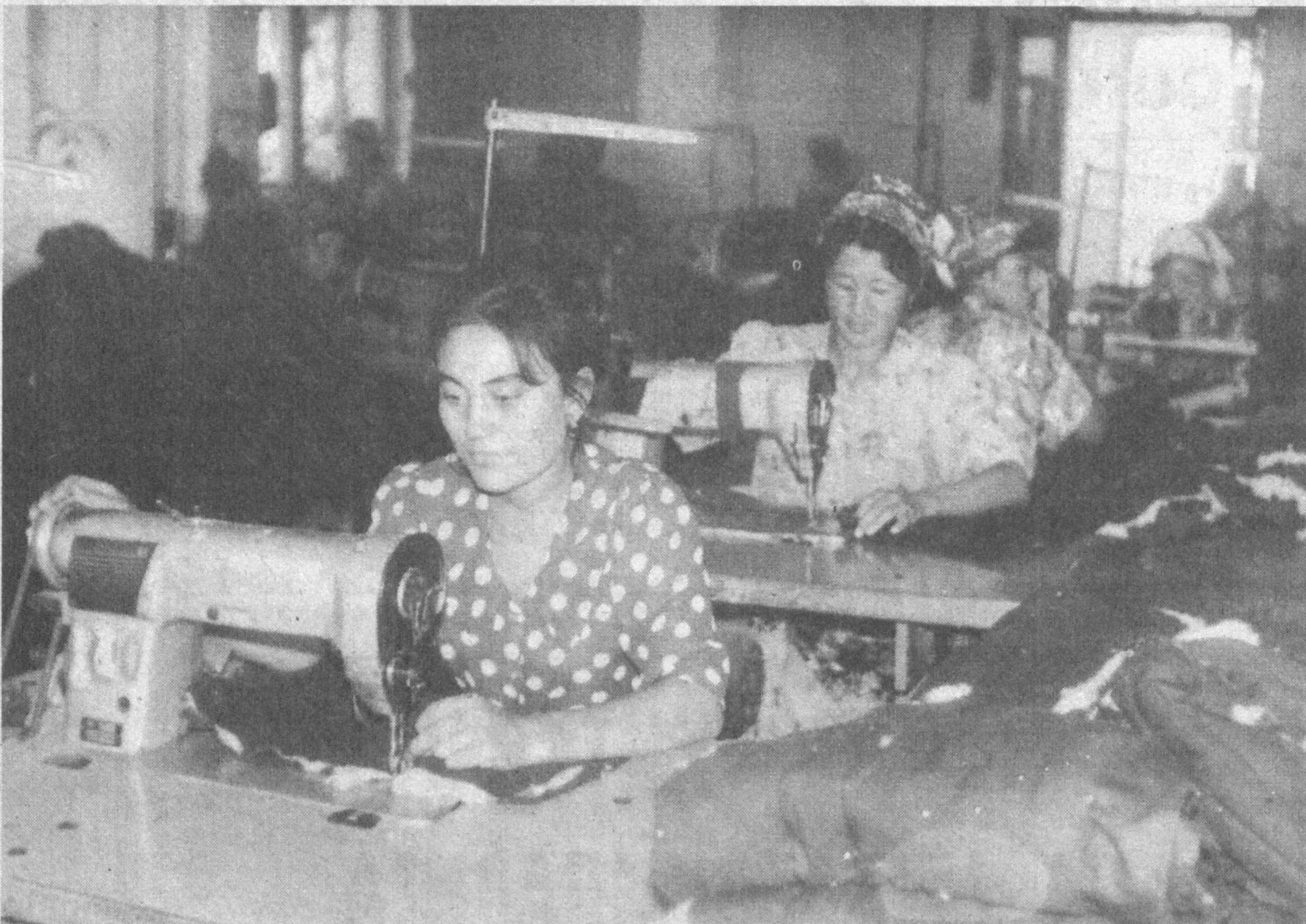
лашмаси филиалининг тикувчилик цехи намунали фаолият кўрсатяпти. Бу ерда ишчилар учун қўлқоп, маҳсулус кийим-кечак, халатлар тикилмоқда.