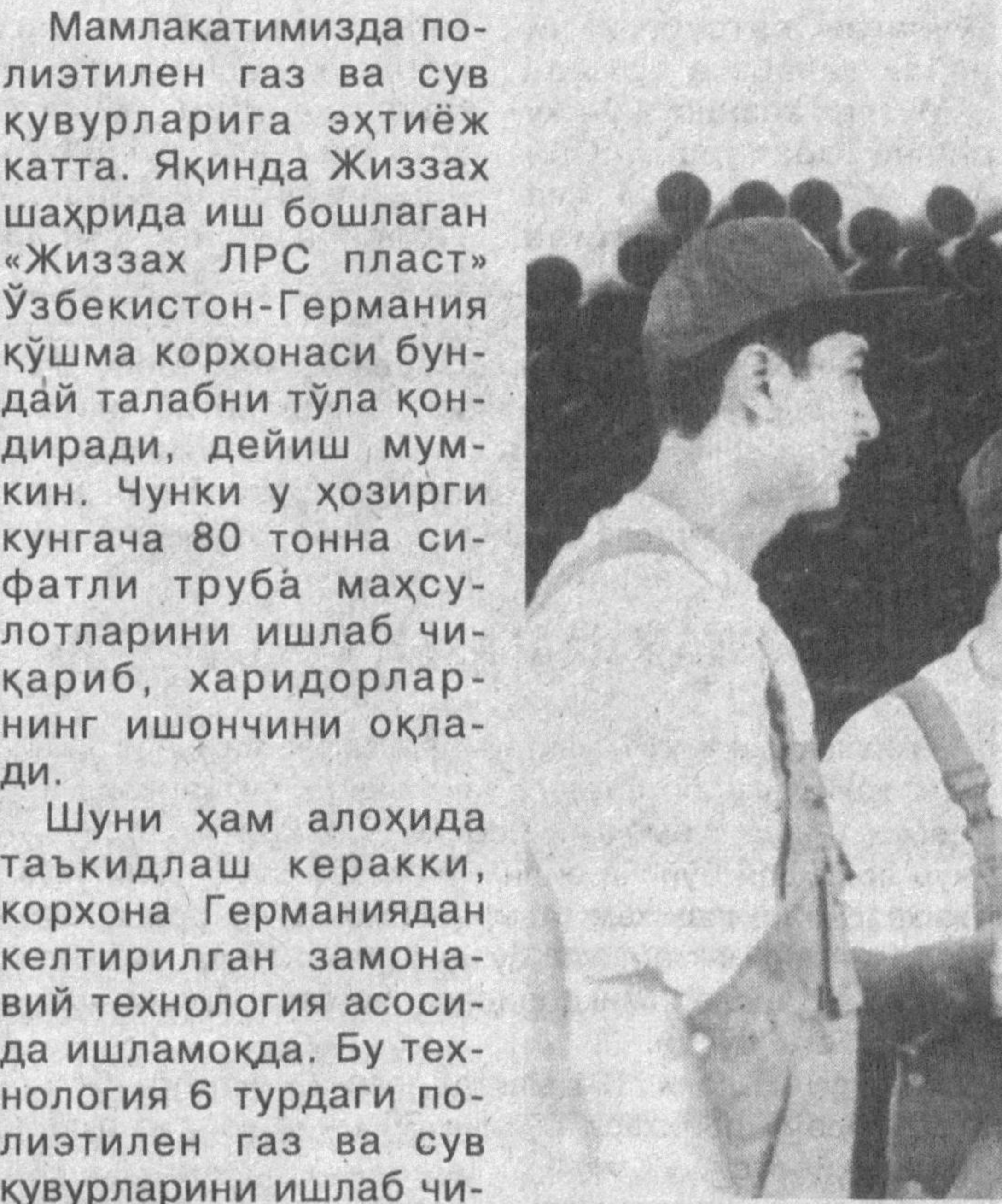
Мамлакатимизда полиэтилен газ ва сув қувурларига эҳтиёж катта. Яқинда Жиззах шаҳрида иш бошлаган «Жиззах ЛРС пласт» Ўзбекистон-Германия қўшма корхонаси бундай талабни тўла қондиради, дейиш мумкин. Чунки у ҳозирги кунгача 80 тонна сифатли труба маҳсулотларини ишлаб чиқариб, харидорларнинг ишончини оқлади.

Унда ўқув жараёнини автотранспорт мажмуи билан уйғунлаштириш, мамлакатимиз автомобил-созлик саноати учун кадрлар тайёрлаш масалалари муҳокама этилди. Шунингдек, олий ўқув юрталари ва Ўзбекистон Фанлар академиясига қарашли илмий-тадқиқот институтларининг олий таълим ҳамда бевосита ишлаб чиқариш муаммоларини ҳал этишдаги ҳамкорлигини ривожлантиришга эътибор қаратилди. (ЎЗА).