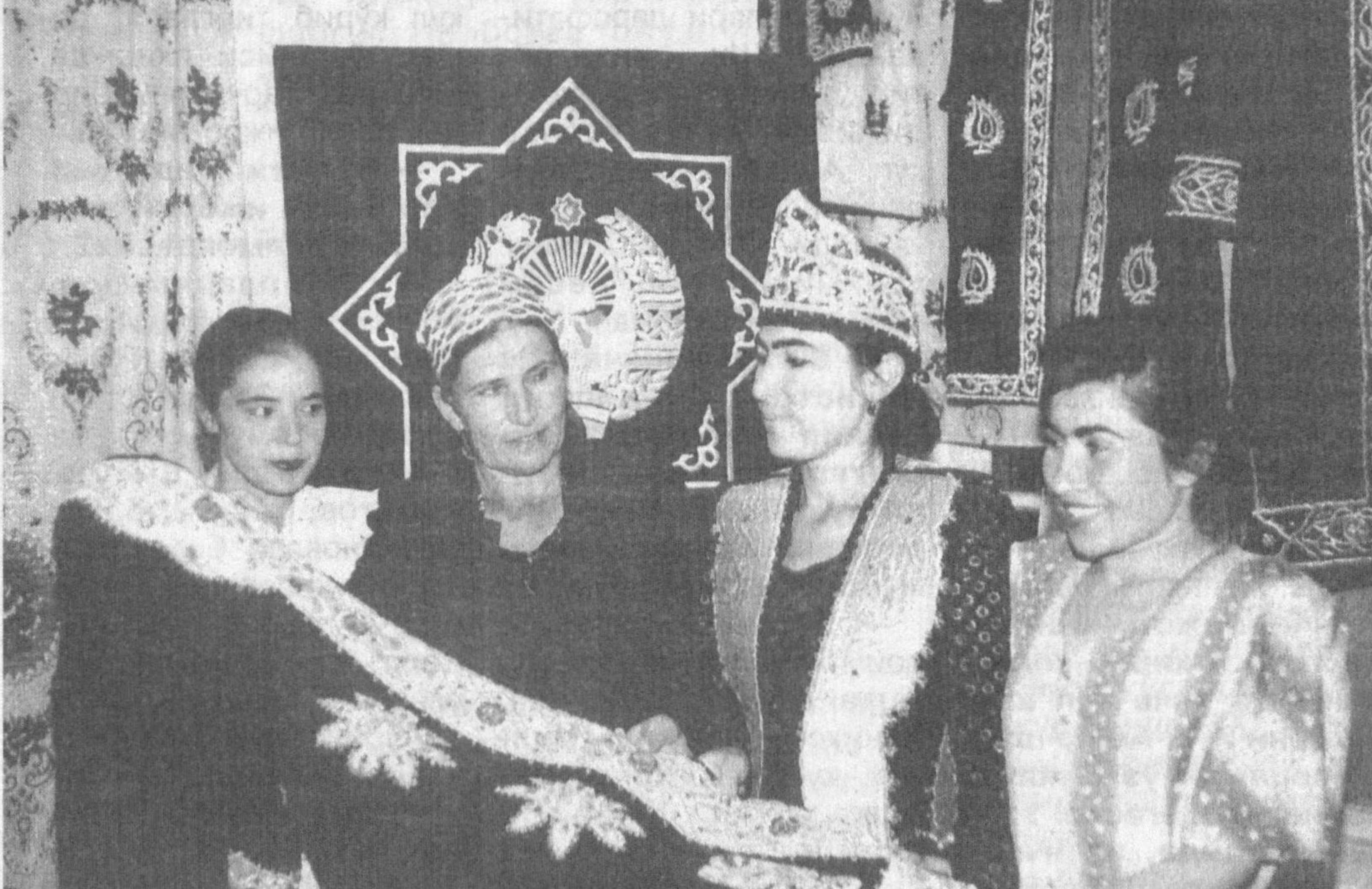
Қизилтепа туманидаги «Хатича» фирмасига қарашли зардуўлик цехида 40 нафар ёшлар меҳнат қилишади. Улар томонидан тайёрлана-ётган миллий зардуўлик намуналарига талаб кун сайин ортиб бормоқда. Суратда: цехнинг илгор ишчилари таёр-маҳсулот сифатини кўздан кечиряпти.

Бу аҳоли нисбатан кам бўлган чўл шароит-ида катта гап. Лекин ҳадемай омонатлар-даги маблаглар уч - тўрт қарра кўпайиши кутилмоқда. Чунки деҳқонларимиз кузги ҳосилларини йиғи-штириб олиб бозорга чиқаришмоқда. Ор-тиқча пуллари ишончли устама олиш учун банкка топшири-шади. Қолаверса, бу-гунгача пахта терими учун 90 миллион сўмдан ортиқ нақд пул тарқатдик. Шу пулнинг бир қисми тагин ўзимизга қай-тиб келса ажабмас. «Туркистон-пресс».