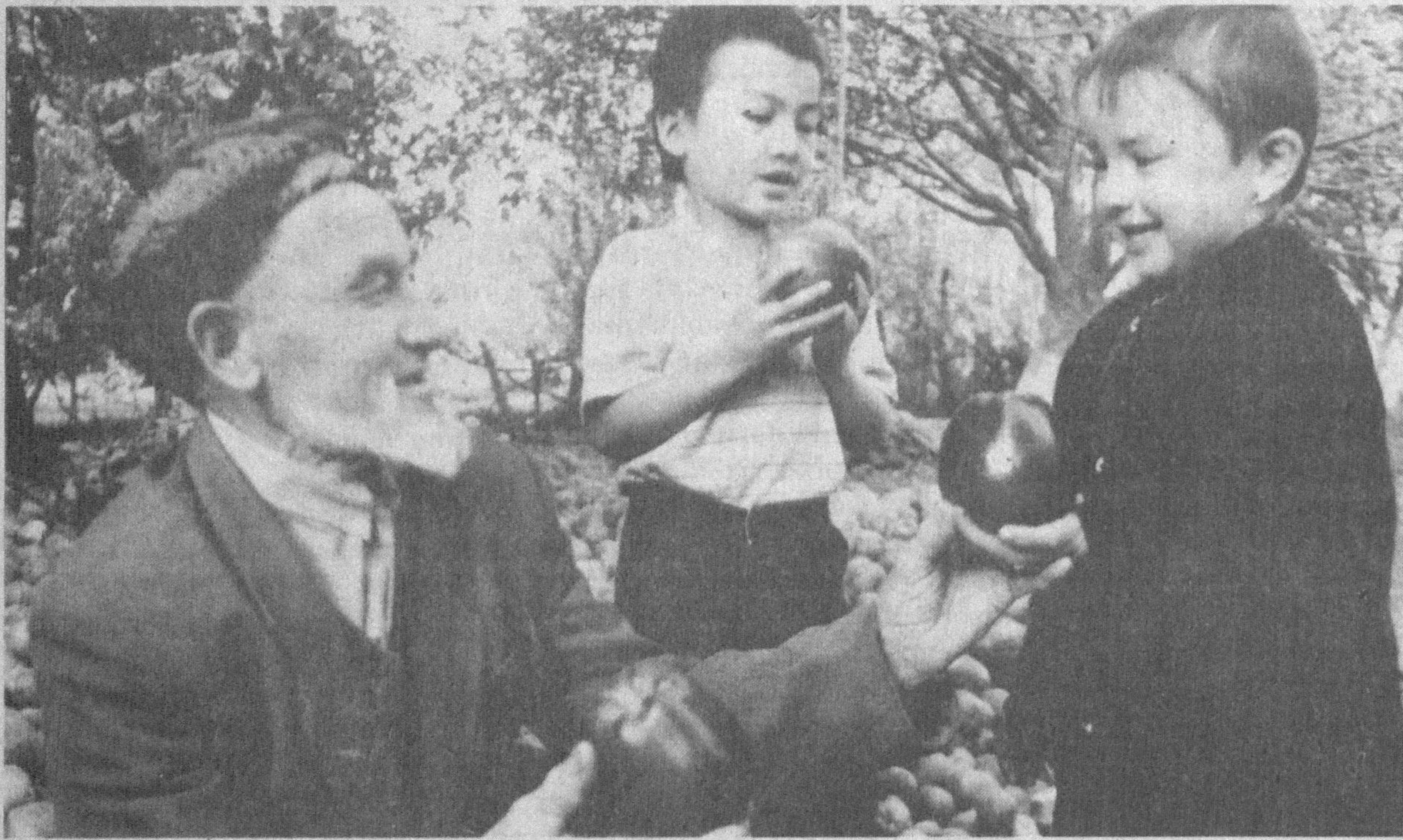
Умринг шу олмайди тотли бўлсин.