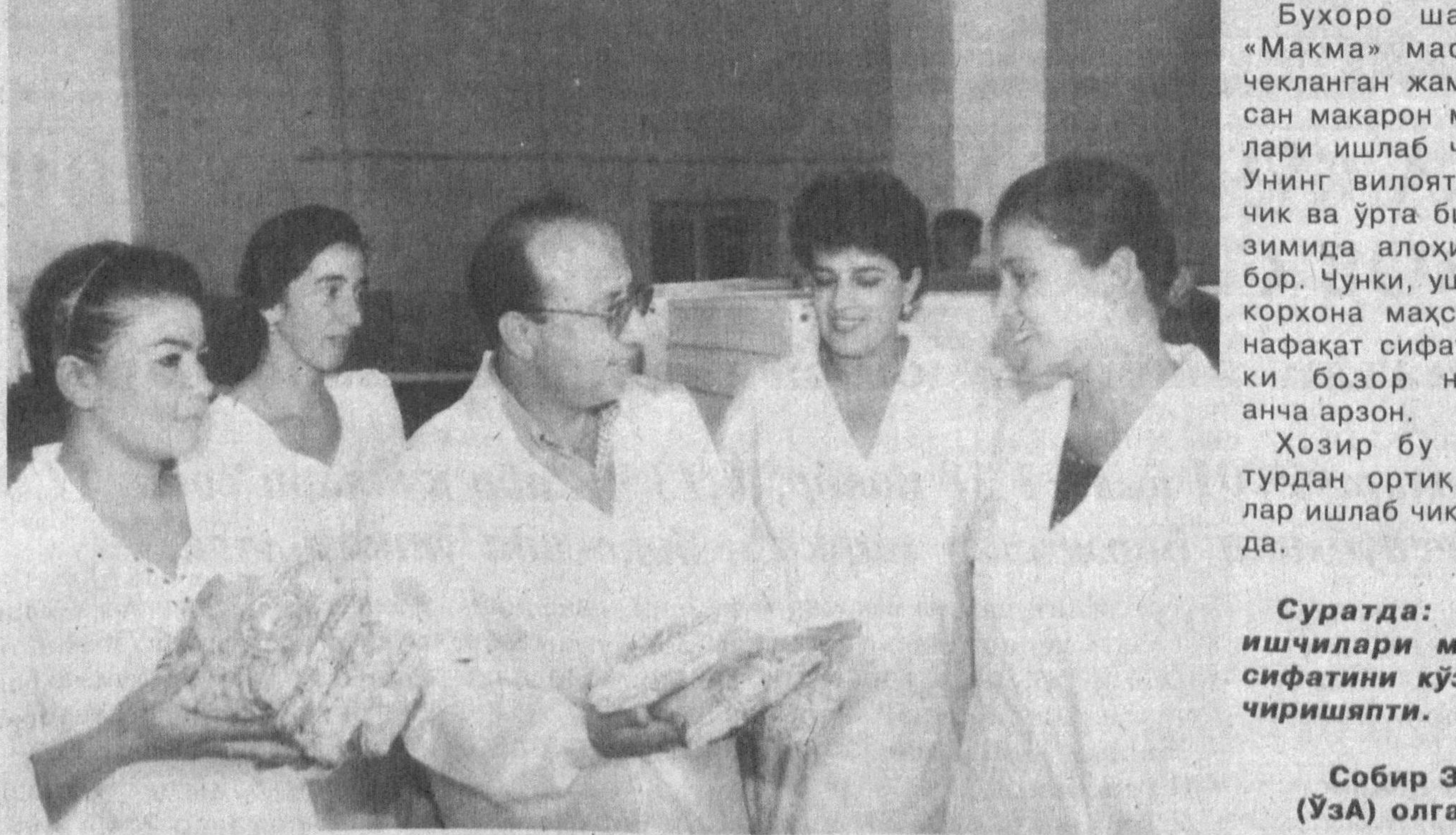
Суратда: корхона ишчилари маҳсулот сифатини кўздан кечиришяпти.

Чилонзор тумани Мехнат бандлиги Бандлик дастури асосида аниқ тадбирларни амалга оширмоқда. Жумладан, оналар ва болалар йили муносабати билан аёллар учун махсус иш ўринлари ташкил этишга эътибор кучайтирилди. Мақсадга эришишда корхона, ташкилот раҳбарлари, маҳалла хотин-қизлар кўмиталари билан ўтказилаётган мулоқотлар, фикр алмашувлар муҳим рол ўйнамоқда. Бундай учрашувлар Нақошлик, Дўмбробод, Олмазор маҳаллаларида бўлиб ўтди. Унда долларб муаммони ҳал этиш имкониятлари излаб топилди.