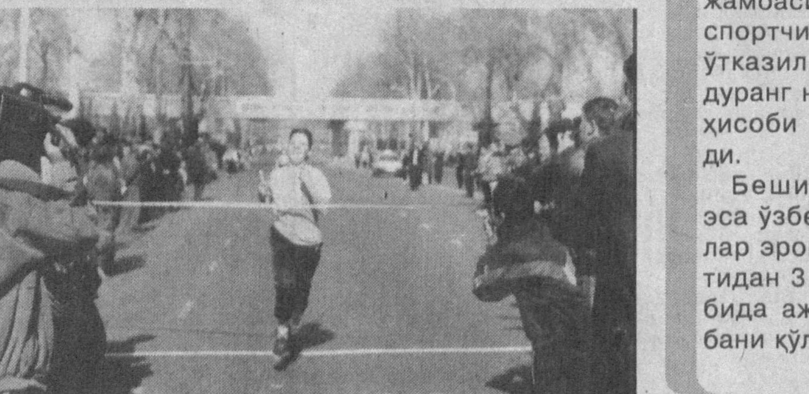
Ха, андижонликлар спорт оммавийлиги, равнақи йўлида ана шундай ишларни амалга оширомоқдалар, улкан режалар орузи билан ишамоқдалар. Бинобарин, бу каби ташаббусларни қўллаб-қувватлаш, имкон қадар бутун республикамизга жорий этмоқ керак.