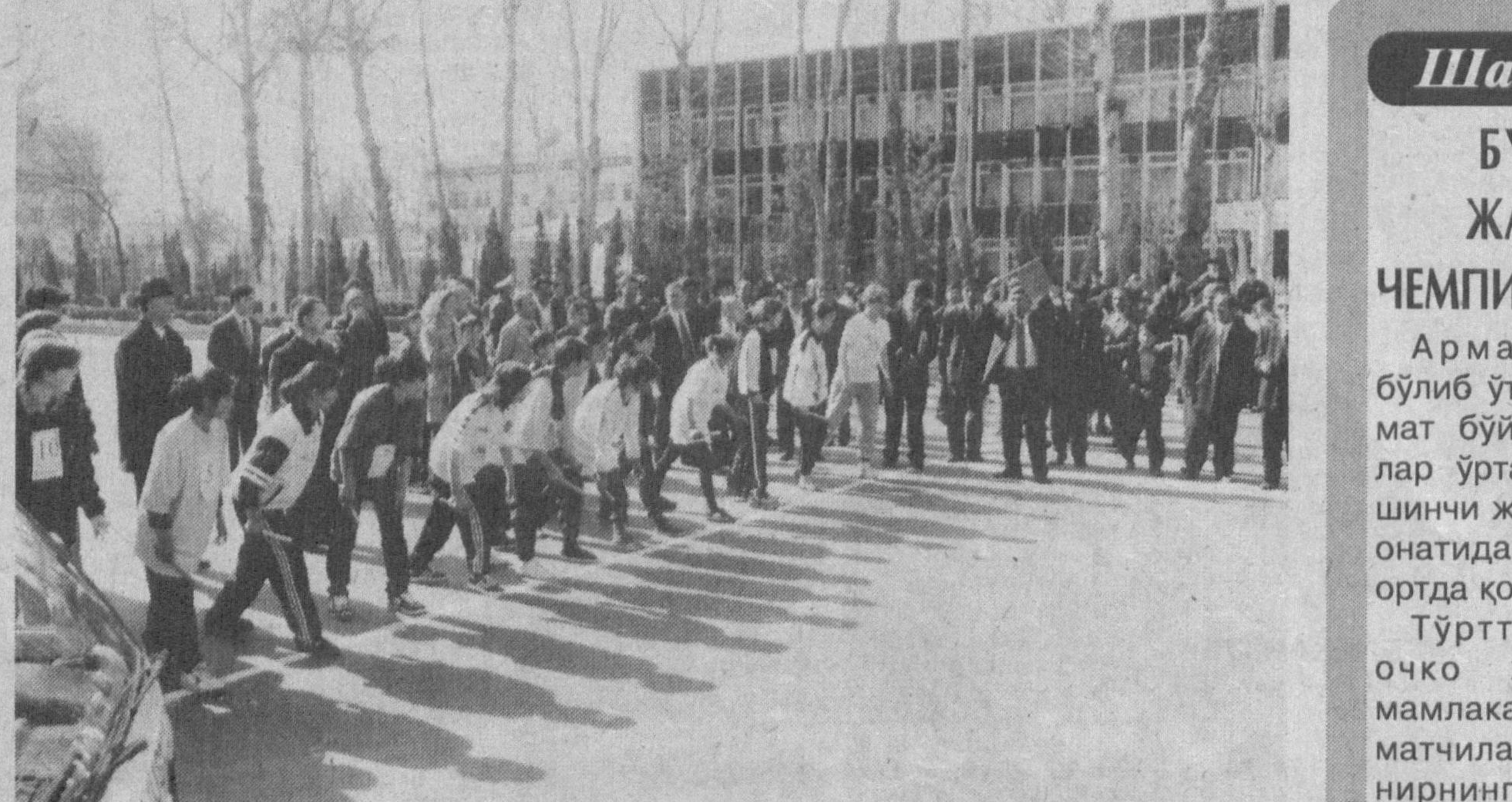
Ха, андижонликлар спорт оммавийлиги, равнақи йўлида ана шундай ишларни амалга оширомоқдалар, улкан режалар орузи билан ишамоқдалар. Бинобарин, бу каби ташаббусларни қўллаб-қувватлаш, имкон қадар бутун республикамизга жорий этмоқ керак.