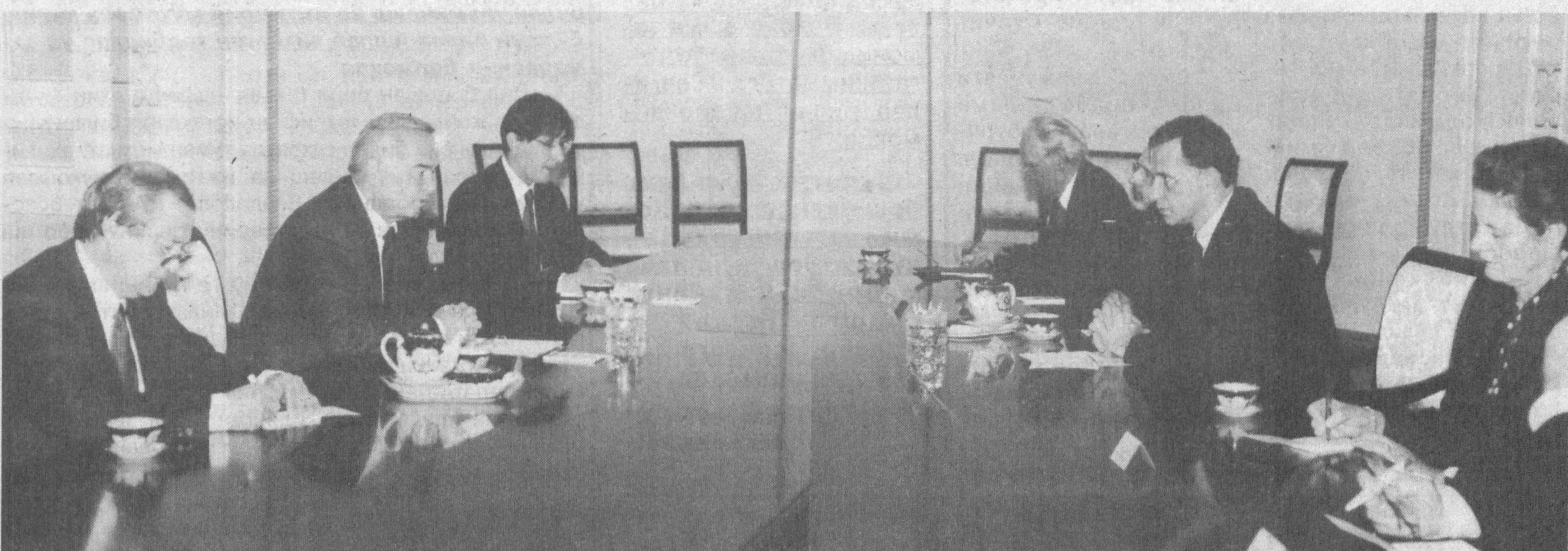
Ўзбекистон Республикаси Президенти Ислам Каримов 22 октябр кўни Оқсаройда Европада Хавфсизлик ва Ҳамкорлик Ташкилотининг (ЕХХТ) амалдаги раиси, Руминия ташқи ишлар вазирини Мирча Жеонени қабул қилди.

нинг февралда Ўзбекистон мазкур ташкилот сафига қабул қилинганидан буён икки томонлама ҳамкорлик жадал ривожлантирди. ЕХХТнинг кўплаб тadbирлари орқали Ўзбекистон раҳбариятининг халқаро миқёсдаги ташаббуслари, мамлакатимизнинг дунёдаги долзарб масалаларга муносабати халқаро ҳамжамият эътиборига ҳавола этилмоқда. ЕХХТ ҳужжатларида таҳдидлар мавжудлиги ва уларнинг хавфи ҳақидаги тезис киритилган. Ташкилотнинг амалдаги раислари ҳар йили Ўзбекистонга келиб, турли муаммо ва можароларнинг олдини олиш, экология, иқтисодиёт, инсоний мезонлар ва умуман минтақа бар-