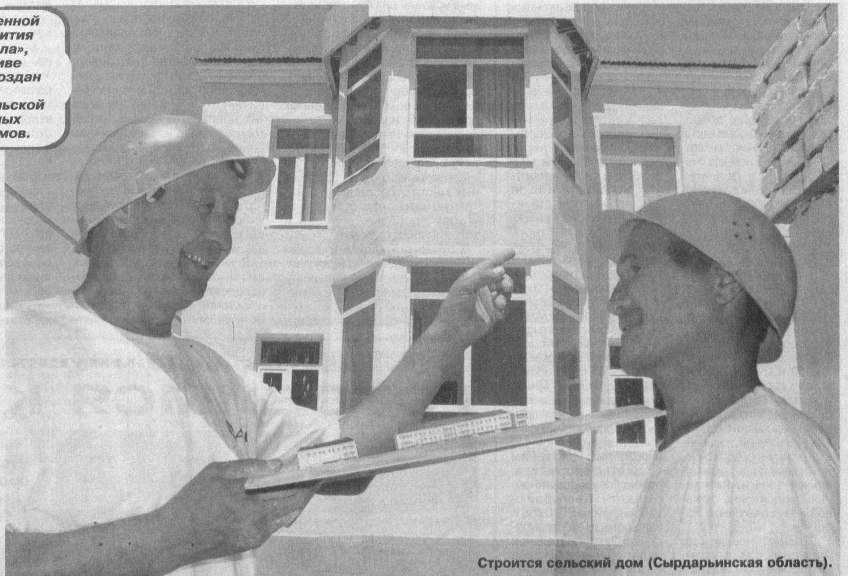
Строится сельский дом (Сырдарьинская область).

Для наиболее эффективного выполнения этого постановления банком была создана спе-