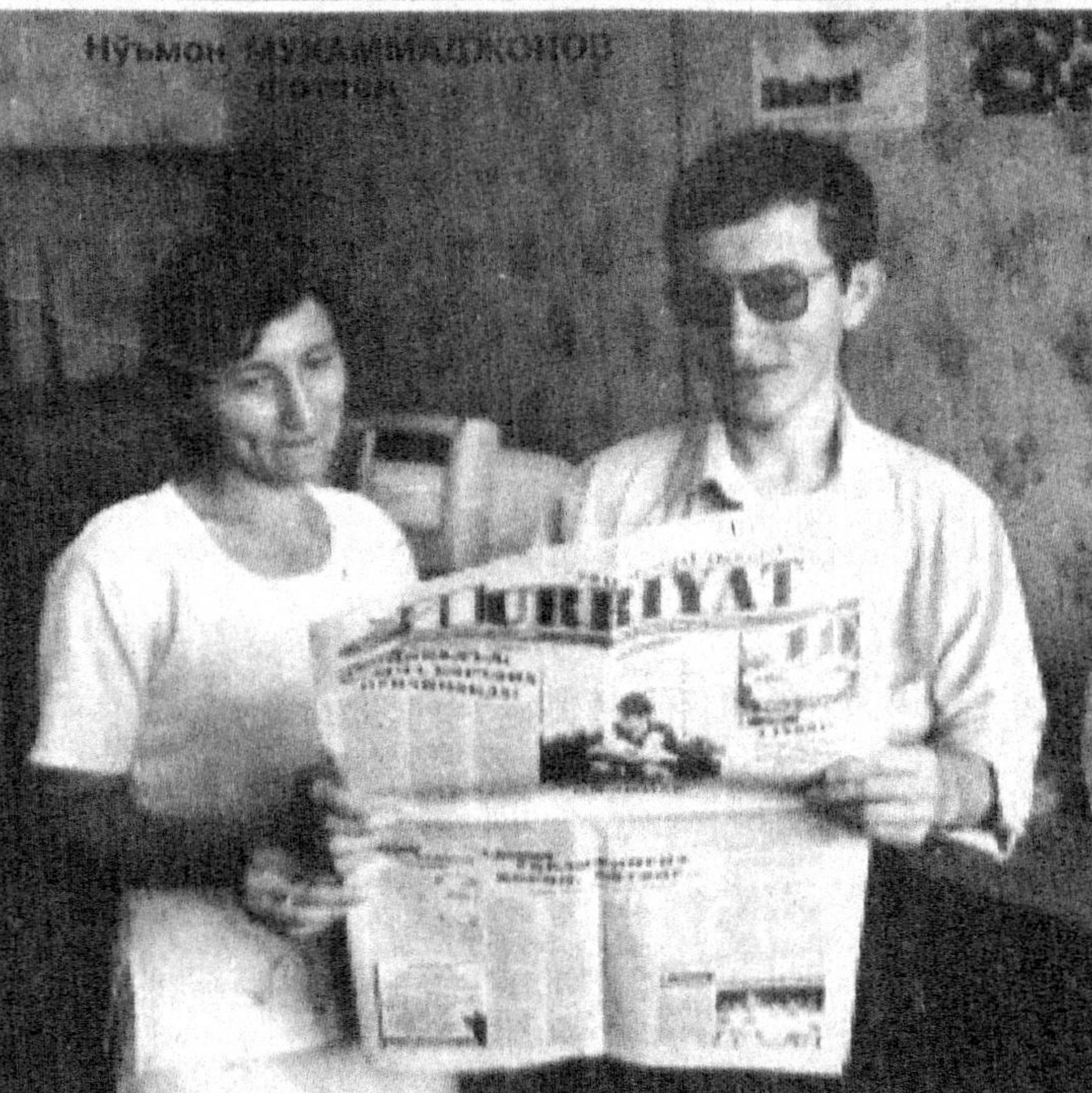
— Ўзимизнинг "HURRIYAT" дан ўтаверсин!