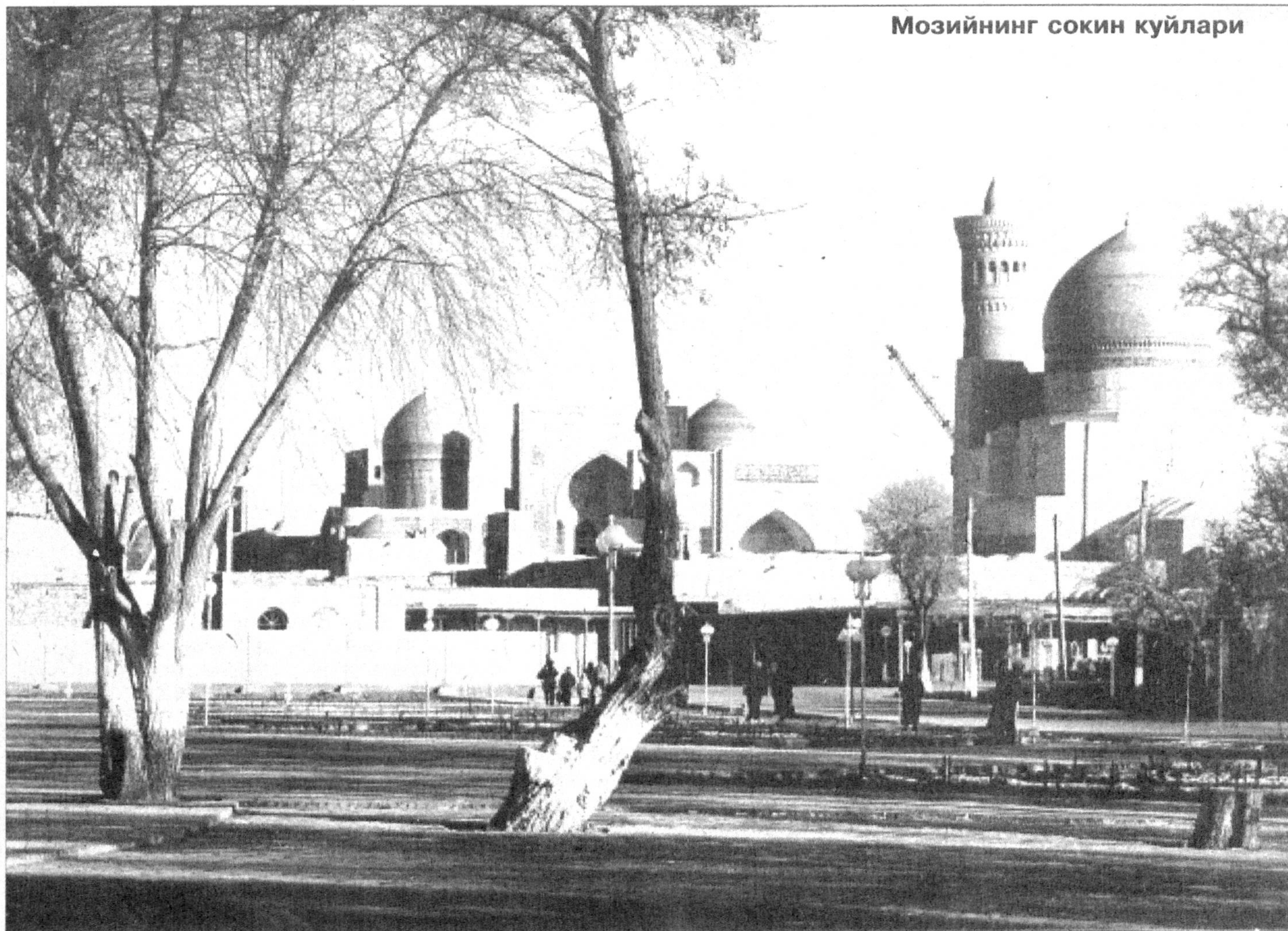
Мозийнинг сокин куйлари