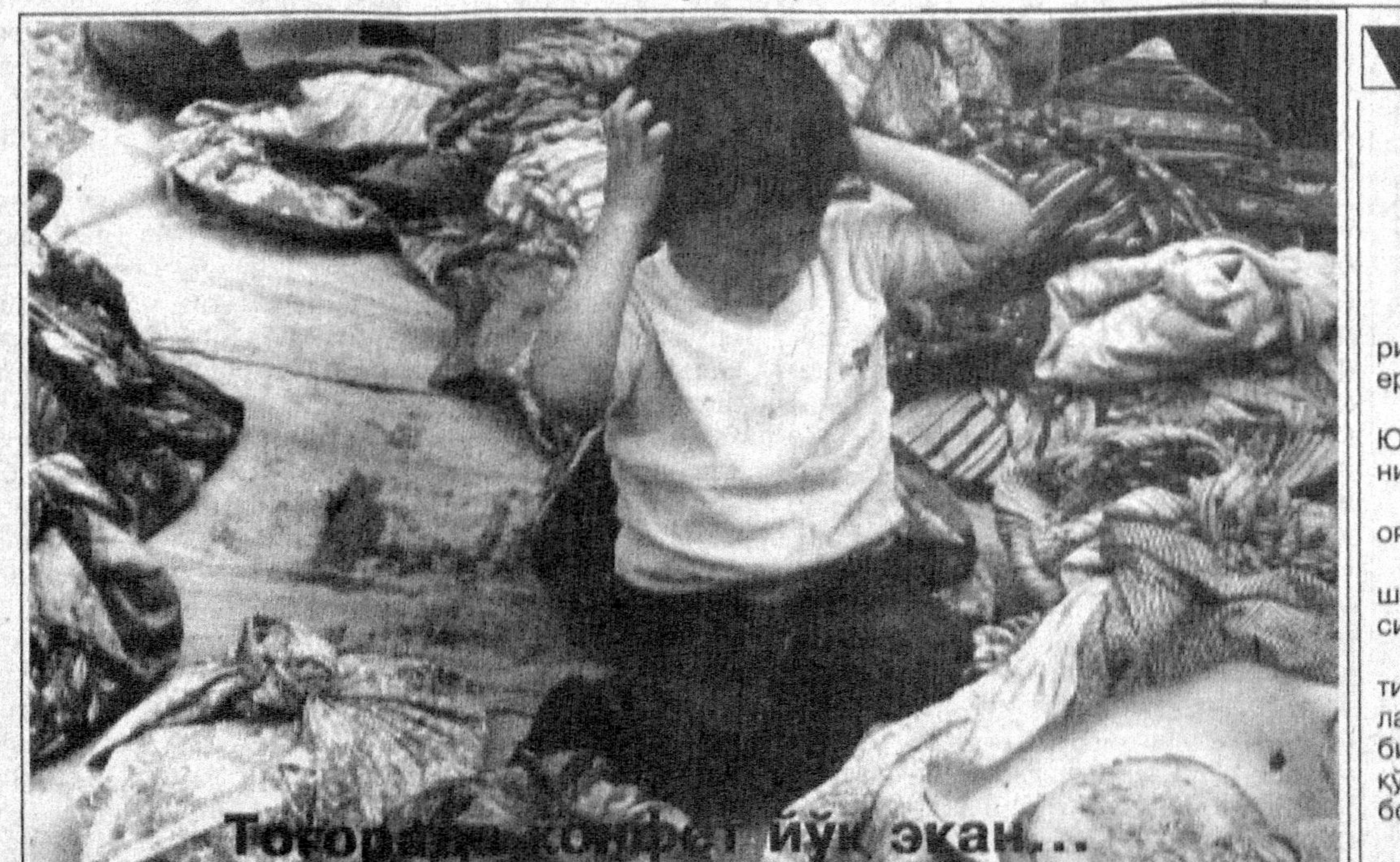
Тошкентда қилинган кашфиёт ишлари...