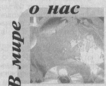
В мире о нас

Средства массовой информации КНР уделяют особое внимание вопросам социально-экономического развития Узбекистана.